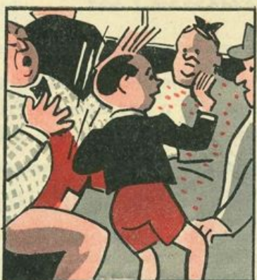
Ma col gomito, nel petto urta un uom ch'è dirimpetto, che con occhi sfavillanti si fa svelto svelto avanti.