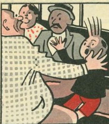
Ehi, villano, cosa fai? bada, bada che son guai. Ed il povero Gastone busca un grosso scapaccione.