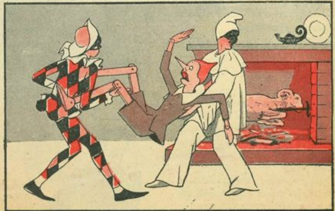
Va Pinocchio a prender posto come legna per l'arrosto.