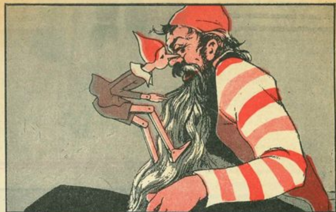
Mangiafuoco, rassegnato, l'uno e l'altro ha liberato