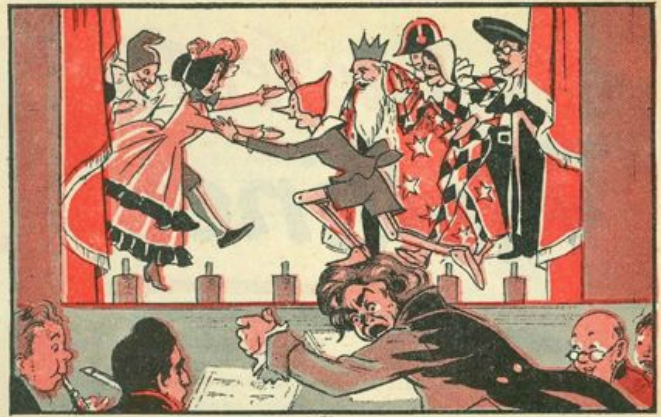
Va a raggiungere Pinocchio, con un salto da ranocchia