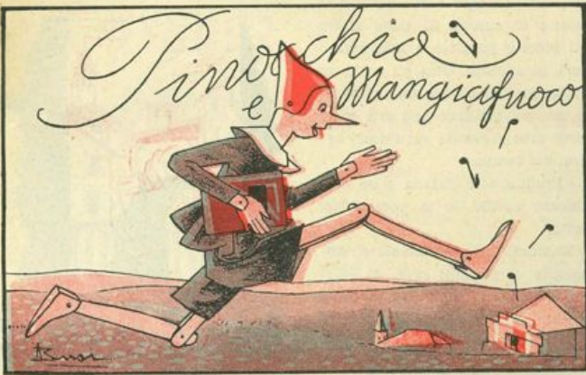
Queste vignette illustran l'avventura ed i guai che Pinocchio si procura