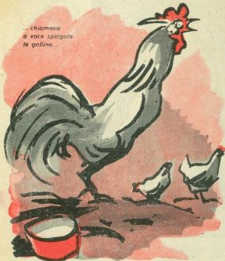
...chiamava a voce spiegata le galline.

Dopo qualche mese di quella vita beata, in cui tutti potevano passeggiare sotto i filari o dormire in una macchia di sole, Pirr ritornò improvvisamente; l'annuncio lo dette un vecchio tacchino, che molti chiamavano il professore, perché insegnava ai pulcini e ai galletti l'arte di mangiare a tavola. Prima ancora che uscissero dal pollaio, egli disse: «Diventeremo brutti come una volta» — e una gallina, dal collo pelato e dalle zampe coi fiocchi che sembravano un paio di pantofole, borbottò: «Avrete fatto certamente un brutto sogno...» Ma non finì di parlare, perché dalla stalla s'intese un abbaio. Le voci degli uomini si fecero gioiose; un'oca, che aveva il collo più lungo delle altre e guardava nell'aia da un finestrino sotto il soffitto, disse: «Il signor cane è accarezzato dal padrone... fa dei salti grandi come la siepe... Ecco, aiuto, viene verso il pollaio...» — e tutti nasosero di colpo la testa fra le ali, col cuore che batteva forte come un pendolo.