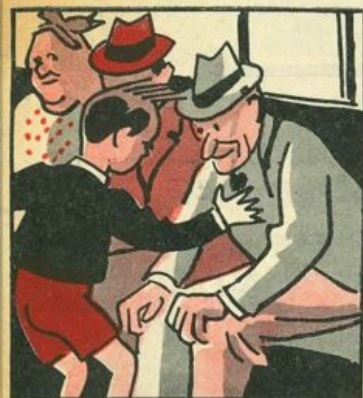
Con premura assai gentile s'alza svelto dal sedile ed al povero vecchietto cede il posto con rispetto.