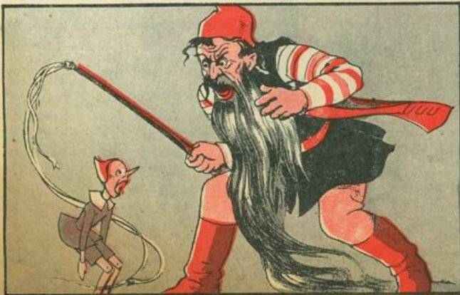
Mangiafuoco furibondo or minaccia il finimondo,