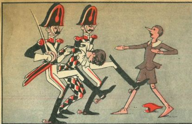
A bruciare, poverino, vien portato l'Arlecchino;