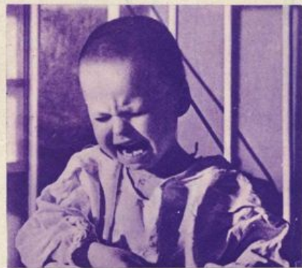
Il vostro bambino fa le bizze perchè vuole essere assicurato presso l'Istituto Nazionale delle Assicurazioni. Accantatelo.

mià pensione. Sentite cuccioletti dal passo ruzzolato, se dite così, la mamma va a pescarla fuori una caramella. Se non ve la pesca, ditelo a me: glielo do io un "cicchetto"... E ditemi: è difficile dire così? Adesso no che ve l'ho insegnato. Avanti allora: — Mamma... prendi questi (debbono essere soldi, ricordate) e poi fammi un libretto... assicurami... iscrivi alla Mutualità scolastica per cominciare la mia pensione... Ormai ve l'ho detto due volte. O cuccioletti, siete testoni se non lo imparate. I. Cinti