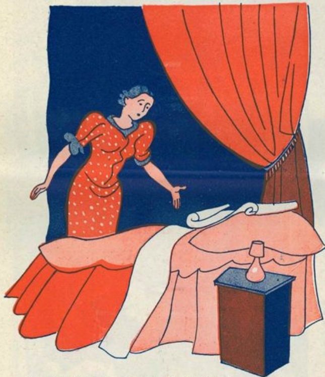
Trovò un biglietto, e sul biglietto: « Cari genitori... »

Possò soltanto dirvi che accompagnati in blocco dal commissario, i « cinque » ormai scoperti, non tar-