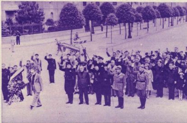
Il Dopolavoro della Direzione Generale dell' I. N. A. in pellegrinaggio a Predappio

Quando il mio babbo avrà finito di parlare da solo chiuso nel suo studio, andrà a parlare a molte brave persone alla mostra delle colonie estive a Roma e mi porterà con sé. Allora i diavoli neri se ne andranno e i suoi capelli torneranno di un biondo esagerato. Io assisterò con gioia allo spettacolo, perché, se nessun diavolo rimane, spero che il babbo mi porti un poco in montagna col sacco, la piccozza e la moto. Spero dunque di scriverle da qualche bel rifugio alpino odoroso di abete e di pancetta fritta con la cipolla e le uova... Ha mai mangiato, Lei, la pancetta fritta con le uova e la cipolla? No? Non provi a farlo in città, per amor di Dio! In città sono garantiti giorni tre di letto con impacchi e limonate purgative, ma lassù Lei di notte