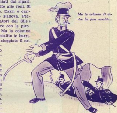
Ma la colonna di destra ha pure assalito...

Prende il tamburo insanguinato del compagno; se lo mette sulle spalle, e ritorna alla carica. Dalla foga, par che le mazze si spezzino.