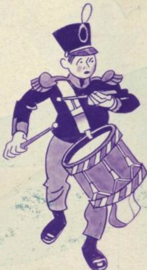
— Rataplum, rataplum, rataplum! —

Appena appena, dopo quasi tre ore di marcia, si scorge uno scialbo chiarore. — Da Fusina, le piroghe avrebbero già dovuto far fuoco... — pensa il colonnello Morandi. Ma niente si ode da quella parte. — Ah! questa nebbia maledetta!