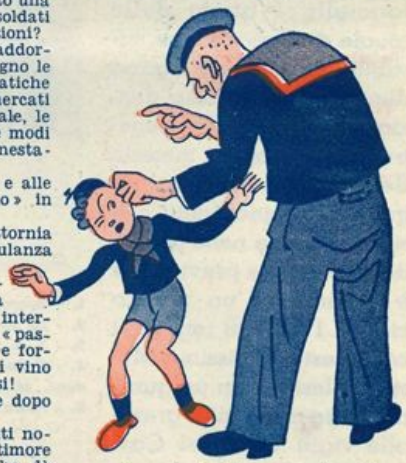
Un marinaio lo tiene per un'orecchio.