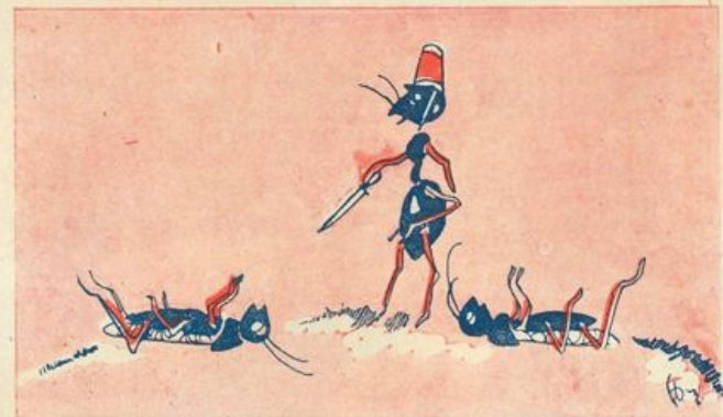
Ma pare impossibile che queste bestiacce cattive

drate, cioè rotondi e allungati come un chicco di grano. E, quindici giorni più tardi, fu osservato il loro meccanismo, perfetto, disotterrando altri, proprio quando stavano per nascere i grillini. Due puntini nero-rossastri si videro nella parte di sopra, e, sotto a questi, un cerchiolino scuro sottile sottile: è il punto, in cui l'uovo si rompe, quando il nascituro comincia a dare le ca-