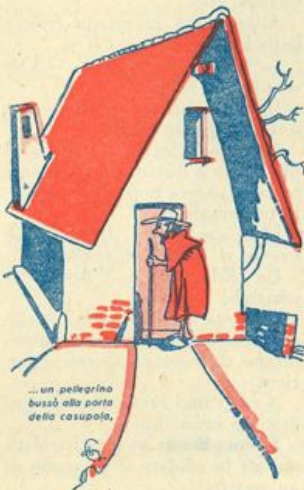
...un pellegrino bussò alla porta della casupola.

— Senti — le mormorò — io desidero lasciare questo mondo vestita dei miei migliori abiti. Chiudisi nel canterano ho uno splendido fazzoletto con cui vorrò cingermi