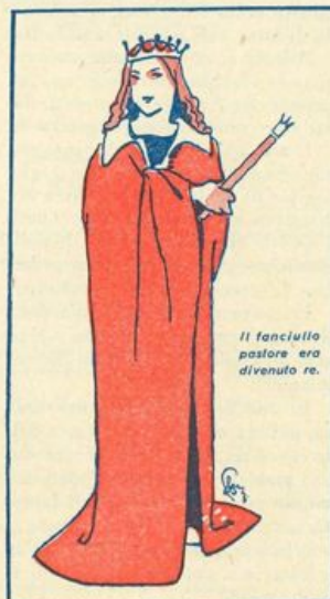
Il fanciullo pastore era divenuto re.