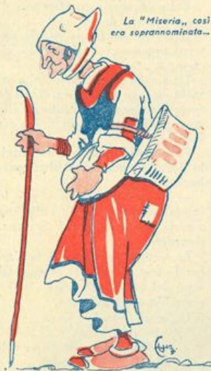
La « Miseria », così era soprannominata...

Gli abitanti di uno dei tanti paesi di campagna vivevano felici