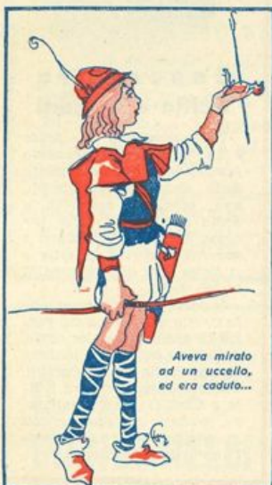
Aveva mirato ad un uccello, ed era caduto...

Folco, per quanto cercasse nella sua memoria non aveva ricordi. Non aveva visto altro che la sua capanna di montanari, l'alpe grandiosa e magnifica con le cime eternamente nevose, le valli profonde, cupe di sassi e di frescura, teneri prati fioriti; non aveva sentito altro che la voce del nonno, il riso dei suoi fratellini,