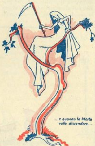
...e quando la Morte volle discendere...

I paesi, le città, le campagne rigurgitarono di persone che la Morte non portava più seco. Per le vie vecchie cadenti e vecchi dalle lunghissime barbe si trascinavano a stento, i malati riempivano gli ospedali, aumentavano le epidemie, diminuivano le industrie