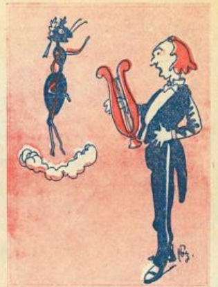
Anche i poeti le hanno cantate

portate per esempio d'industriosità, di previdenza, di saggezza.