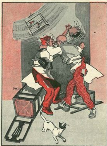
I due ometti, riscaldandosi sempre più, vennero dalle parole ai fatti...

— E questo è nulla ancora? Ti ci vuole soprattutto un modello, che so io? un campione, un esemplare. Perché, ficitelo bene in zucca, a fare un burattino maschio, via! se ci ha il naso lunghetto o rincagnato e le orecchie a ventola e se riesce meno scultoreo del nostro David o del Perseo di Piazza della Signoria,