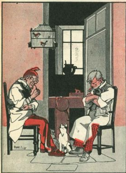
...divenuti seri e meditabondi, guardandosi le scarpe, stettero alquanto in quella posa silenziosi.

— Non me l'avevi mai detto, — borbottò Ciliegia persuaso e smettendo un poco il broncio — ma non