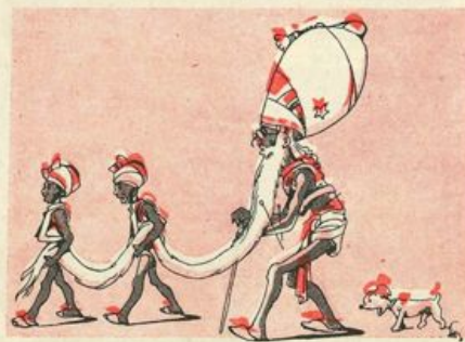
...dovette noleggiarne un secondo...