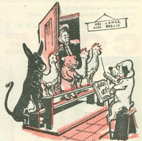
«SU, LA PRIMA FILA»

Il gallo per far presto ad arrivare a casa, faceva un salto e un mezzo volo. Quando fu nell'aia i pulcini gli corsero tutti intorno, gridando: «Papà! Papà!» — e intanto la mamma loro, una gallina con un vestito tutto bianco, diceva a una vecchia tacchina: «Signora Rosa, ha visto? nella nostra famiglia c'è soltanto della tranquillità e dell'affetto». Dopo qualche minuto le oche, i galletti e i tacchini si chiedevano