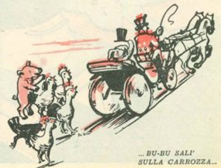
... BU-BU SALÌ SULLA CARROZZA...