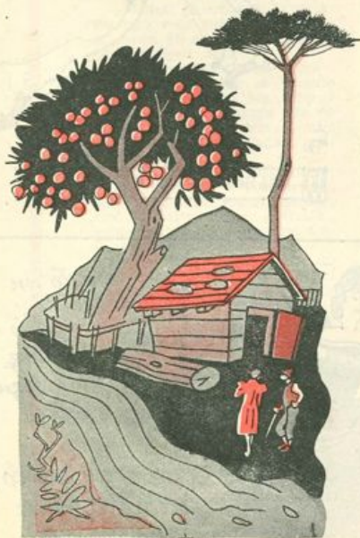
LA CAPANNA DEGLI ARANCI

...SCONFITTO E INSANGUINATO RIPRESE LA VIA VERSO IL CASTELLO.