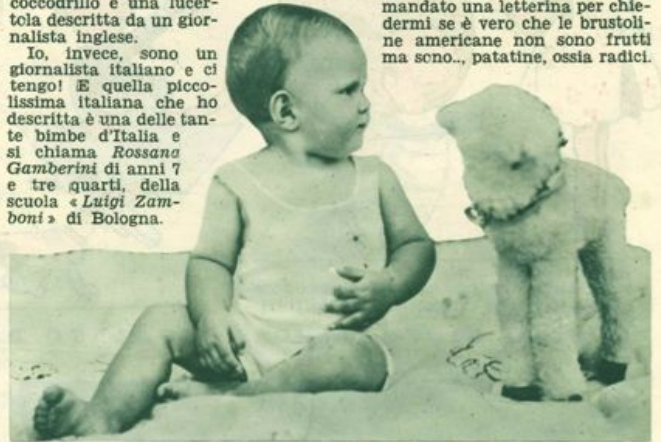
S. A. R. la Principessa Maria Pia di Savoia