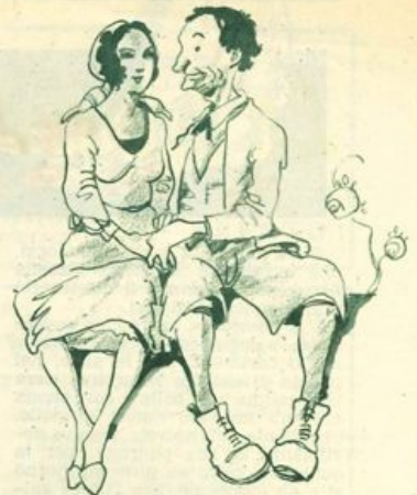
... e le scarpe si dicevano le stesse parole...

Era giorno di festa, in quel casolare. Contadini con fiori sul cap-