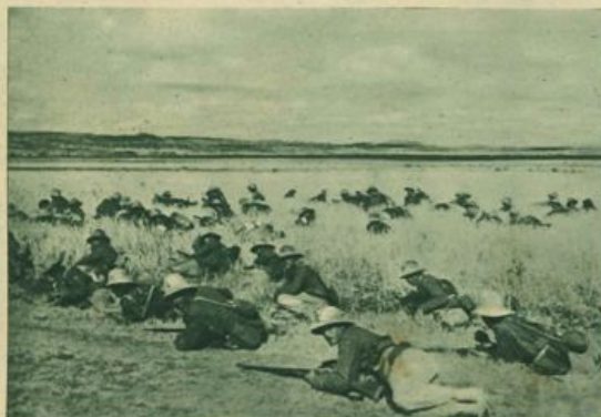
I nostri eroici soldati che non temono né sole né fatica.

sane pagnotte che ogni giorno consumano le nostre truppe, alle infinite teorie di scatole di carne, alle migliaia di limoni, che sono un ottimo disinfettante. Ma oltre a tutto questo, alle frutta, alle verdure, un'altra sostanza forma la base dell'alimentazione: una sostanza alla quale anche voi, piccoli lettori, siete legati da particolare simpatia: lo zucchero. Ecco l'alimento che dà vigore e salute, che ritene-