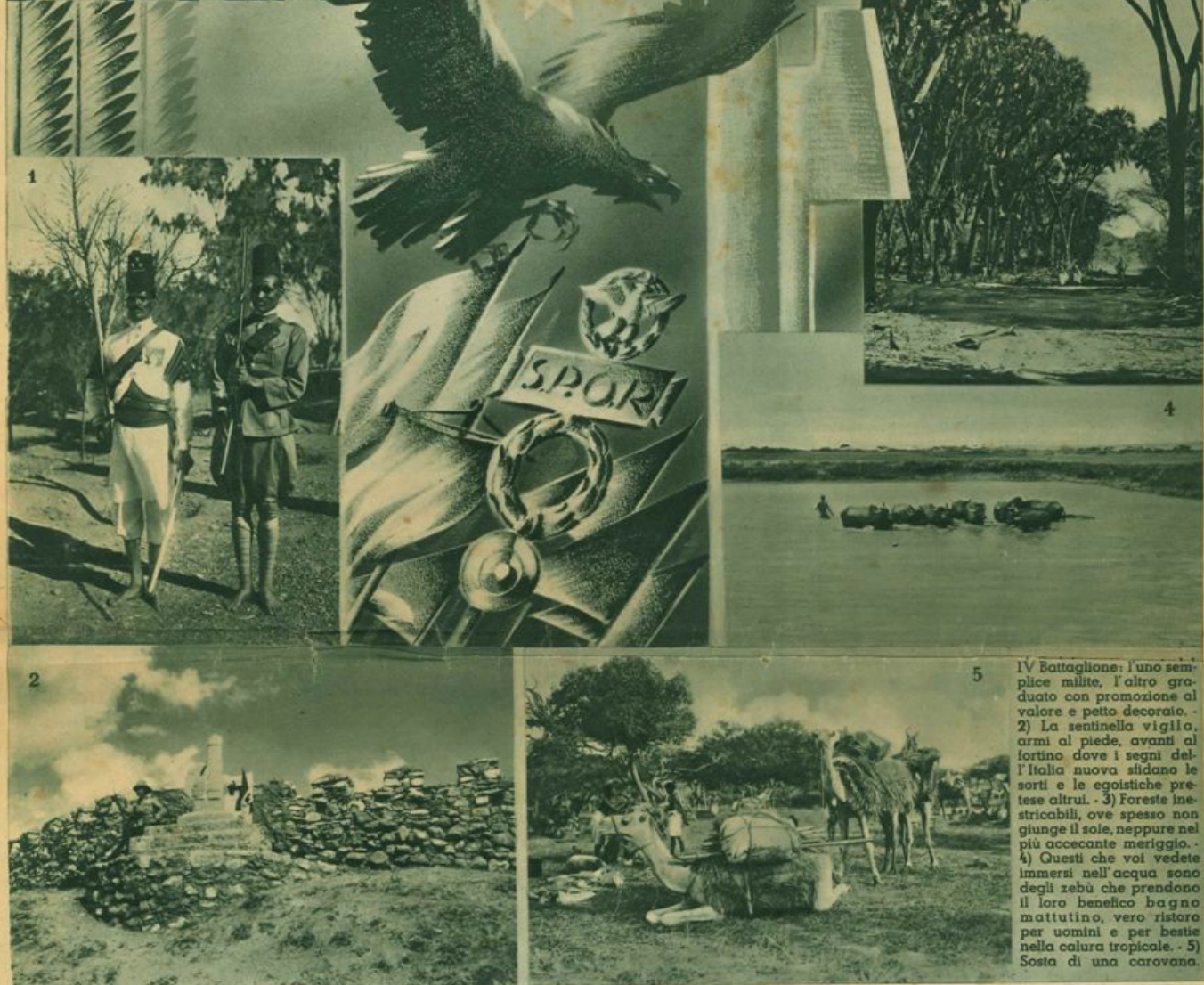
IV Battaglione: l'uno semplice milite, l'altro graduato con promozione al valore e petto decorato. - 2) La sentinella vigila, armi al piede, avanti al fortino dove i segni dell'Italia nuova sfidano le sorti e le egoistiche pretese altrui. - 3) Foreste inestricabili, ove spesso non giunge il sole, neppure nel più accecante meriggio. - 4) Questi che voi vedete immersi nell'acqua sono degli zèbù che prendono il loro benefico bagno mattutino, vero ristoro per uomini e per bestie nella coltura tropicale. - 5) Sosta di una carovana.