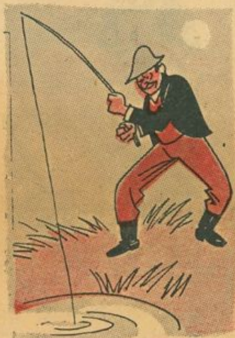
L'ho presa! — urlò — Aiuto! aiuto!

— Quando sarò ricco — egli diceva a quanti gli offrivano un po' di