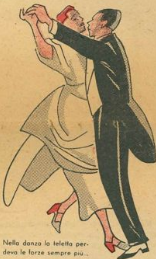
Nella danza la teletta perdeva le forze sempre più...

— Volete ballare con noi? — chiesero alle compagne.