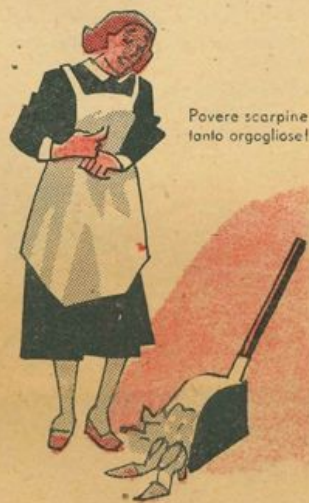
Povere scarpine tanto orgogliose!

La cameriera, che spesso godeva degli scarti della padroncina, le guardò anch'essa con disprezzo. Due scarpe d'argento tutte sciupate! Non servivano proprio a nulla. E le lasciò nella spazzatura. Povere