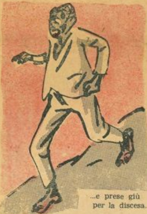
...e prese giù per la discesa...

Il bravo ragazzo cominciò la sua esposizione con una foga che lo