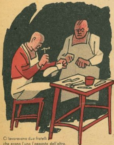
Ci lavoravano due fratelli che erano l'uno l'opposto dell'altro.

Le scarpette d'argento rabbrivirono al contatto volgare: « Gente malcreata! Così si conservano le distanze? »