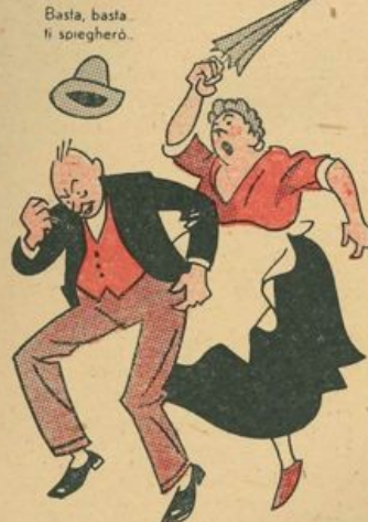
Basta, basta ti spiegherò.

della palude. Era sparito il vento e sul misero laghetto la luna, raggiante, civettuola, si specchiava così a fior d'acqua da sembrare, a Tonto, quasi a portata di mano.