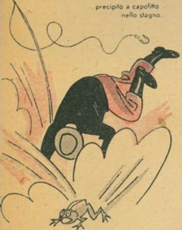
precipitò a capofitto nello stagno.

sero e con lui si misero a tirare la canna con quanto fiato avevano. — Forza Menico, Gigi a destra, in qua, in là... ecco! I tre uomini si trovarono gambe all'aria sul prato, bagnati e coper-