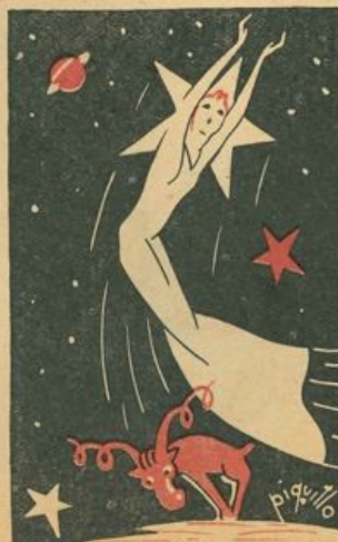
...con una formidabile testata la scaraventò...

I carri erano di dimensioni diverse: e ambedue erano chiusi: chissà che cosa contenevano? Codachiarà, sempre monella, volle appagare la sua curiosità, e aprì l'uscio del Carro Minore: ne