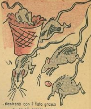
rientrano con il fiato grosso e una più grossa paura...

Un'irrefrenabile risata sale dalla gola degli uccelli, sveglia