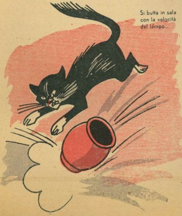
Si butta in sala con la velocità del lampo...

A proposito — annuncia il maestro di musica — a domani la prova del coro a cinque voci. A domani!