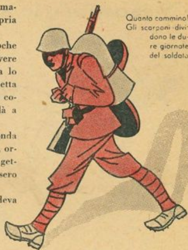
Quanto cammino! Gli scarponi dividono le dure giornate del soldato.

mati dal lungo uso, ma non cedono; e il volontario guarda quei primi compagni della sua fatica, come si guardano le cose vive.