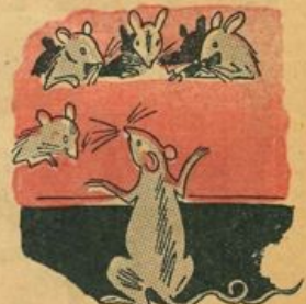
Se gli uomini ci vedessero finirebbero di giudicarci male!

Oh! le movenze leggiadre delle ballerine! Con garbo piegano il capo or qui, or là, saltellano con civetteria e muovono a tempo le code adorne di fiocchetti