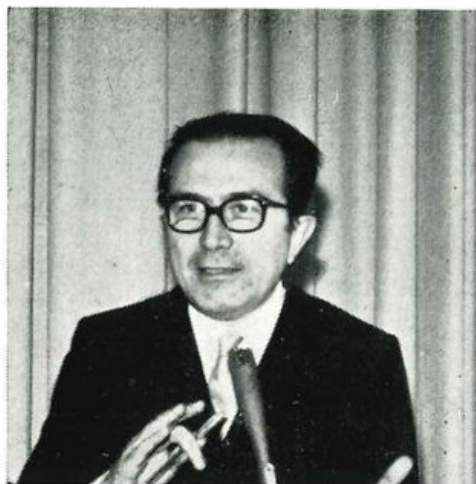
On. Dott. GIULIO ANDREOTTI Presidente del gruppo democristiano alla Camera dei Deputati

Sono particolarmente lieto per l'opportunità che oggi mi è offerta di trattare in qualità di relatore, di fronte ad un pubblico altamente qualificato, l'importante tema dei rapporti fra sport ed assicurazione un tema del quale non mi nascondo la complessità, ma che affronto volentieri, essendo un argomento a me particolarmente congeniale.