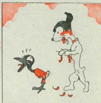
QUEL BRICCON MATRICOLATO L'INFELICE HA SPENNACCHIATO!