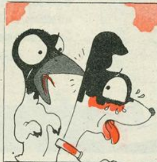
L'UCCELLACCIO INFURIATO, IN RICAMBIO L'HA BECCATO...