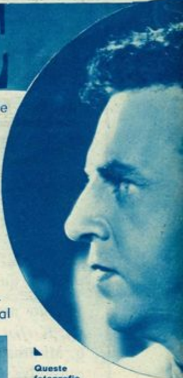
Queste fotografie sono state tratte dalla pellicola

pione», e aveva detto tutto, perchè proverbiale era in Roma la tradizionale educazione degli Scipioni, che si rivelava nel profondo rispetto alle cose sacre e all'autorità dello Stato, nella schietta moralità e nell'alto senso di generosità verso il prossimo. Ma divenuto giovanetto, Scipione l'Africano balza d'un tratto alla ribalta della storia, con un atto di leggendario eroismo. Fu durante la battaglia del Ticino, cioè al primo scontro d'Annibale con gli eserciti di Roma in Italia, dopo la famosa attraversata delle Alpi. In questa battaglia il giovanissimo Scipione accompagnava suo padre comandante le forze romane, il quale aveva dato al