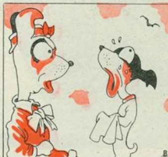
FA LA MAMMA: — BEN TI STA! — CHI FA HALE, HALE HAI! —