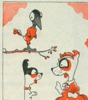
« LASCIA STAR QUELL'UCCELLACCIO! — FA LA MAMMA — CATTIVACCIO! »

Abbandonata sopra una poltrona, Dolores pareva una Madonna davanti alla Croce.