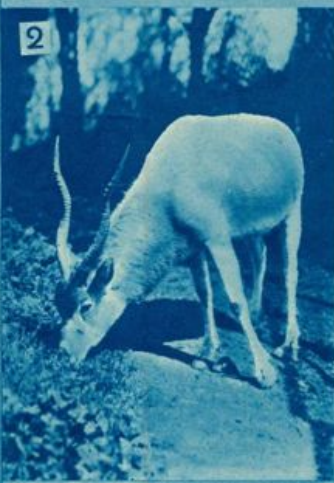
1. Questo sinistro animale è lo sciacallo. Il suo corpo, il suo andamento, la sua voce lugubre ne fanno un poco raccomandabile amico. 2. Alberi, erbetta, sole illuminante in pieno questa gazzella, che ignora del pericolo trascorre i suoi momenti nell'ambiente a lei più gradito. 3. Queste due volpi bianche atteggiavano il loro aspetto a dubbioso timore. Una guarda qualcosa che la preoccupa e l'altra sembra interrogare la compagna.

Senza dubbio, molti dei vostri padri, avranno la passione della caccia, e, più o meno fortunati nell'incontro della selvaggina e nella uccisione di essa, si saranno dispersi nel fatidico giorno di apertura, per le campagne circostanti con i loro carnieri e gli speranze. Ma del resto qualche tutti i colpi vanno inutilmente spersi cercato fugga. Anche in Libia, nella Mediterraneo, comitive di cacciatori si vero si presenta in quei territori di e distanze sono un po' diverse e ti stivali, ma parte in motocicletta, che qualche centinaio di chilometri, verso le zone costiere e verso l'in- e possibilità venatorie. Se infatti in che di piccola mole, Santo Uberto ete la strada percorsa all'andata, ementi tra lepri e pernici. Talvolta ca- rasserò con nelle macchine guarnite di centinaio; ma quest'anno, in cui ore e colonizzatore ha scacciato le sstata meno abbandonante sebbene ovani camerati e prossimi cacciatori o è sano e benefico per il fisico e