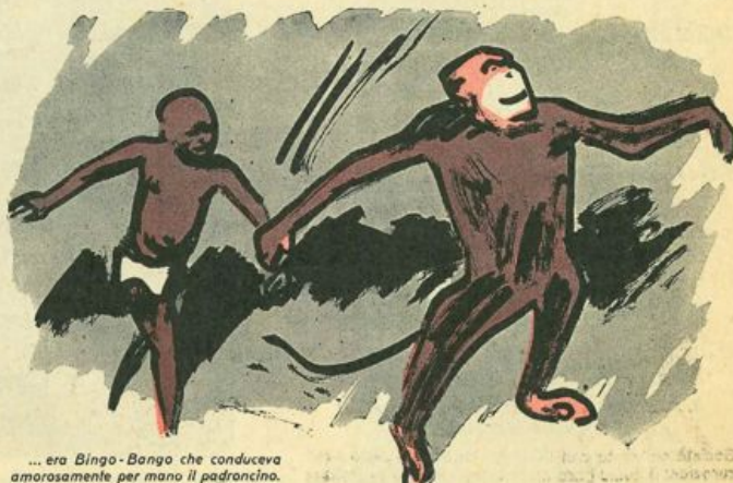
... era Bingo-Bango che conduceva amorosamente per mano il padroncino.