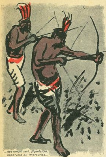
... due omoni neri, giganteschi, apparvero all'improvviso...

cautele e le mosse dei guerrieri. Chi era? Era Bulu-Buru, che ormai da troppo tempo moriva dalla voglia di seguire il babbo alla guerra.