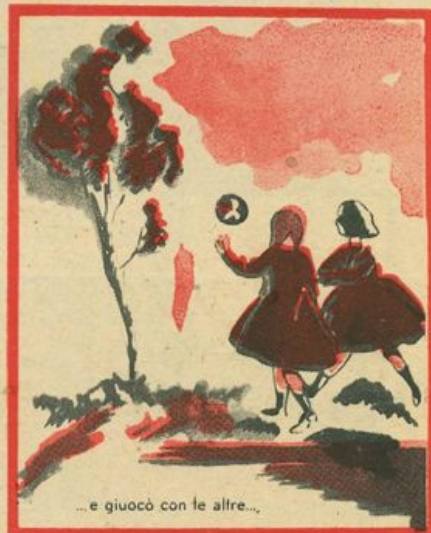
...e giocò con le altre...