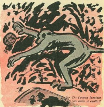
Chi l'aveva lanciata con mira sì esatta?