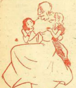
... ed essa li abbracciò

Si volsero e videro una bella signora dai capelli color dell'oro, vestita di un lungo abito