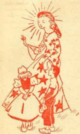
La bella signora sorridendo li chiamò

Sulla riva di un piccolo fiume c'era un mulino. Vi abita-