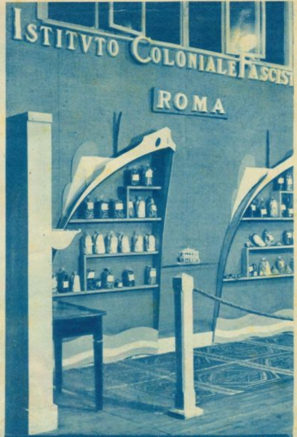
L'elegante padiglione dell'Istituto Coloniale Fascista alla Mostra del Giugno Genovese.