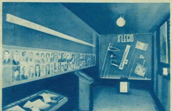
La sala della "X Legio", allestita dalla Federazione Fascista di Bologna con materiale in gran parte fornito dall'Istituto Coloniale Fascista