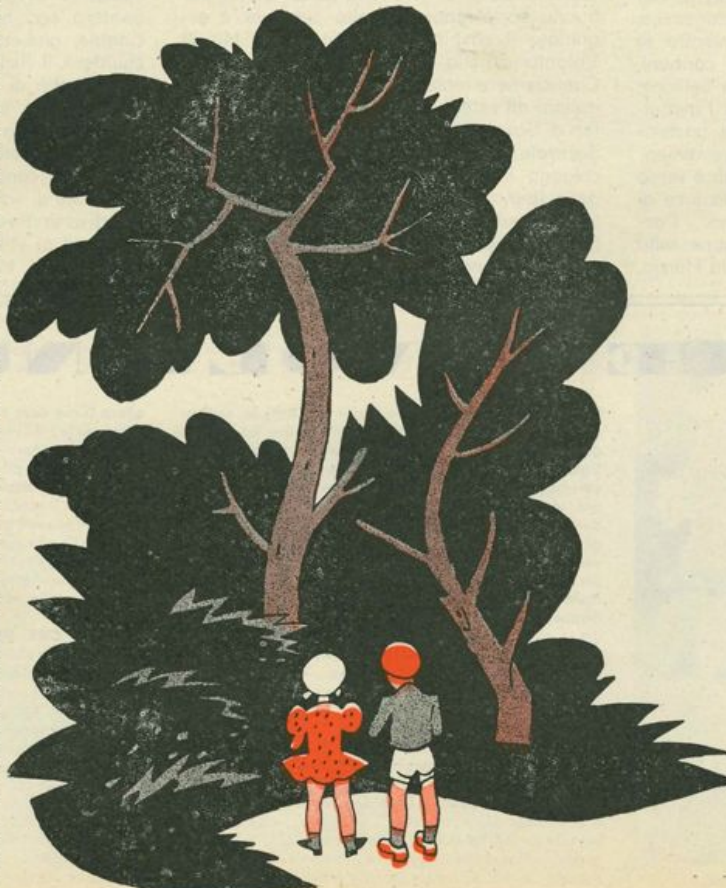
Davanti a loro il bosco si stendeva con tutta la sua fresca verzura...

Vi accontento subito amici miei. I due bambini hanno fatto un