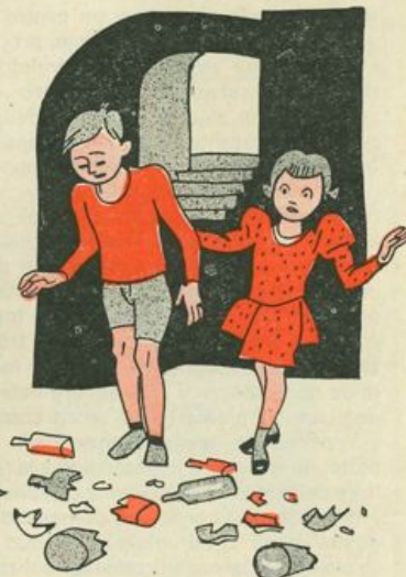
...erano precipitati al suolo infrangendosi miseramente...