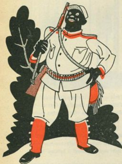
E tutto vestito di chiaro con due grandi stivaloni...

Tutti i miei piccoli lettori stanno per versare lacrime di raccapriccio. Dunque, Orlandino e Ninni fini-