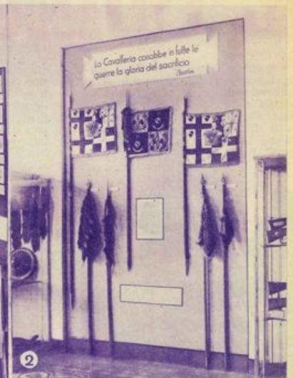
1) Cimeli della recente guerra accanto alle effigi degli antichi capitani d'arme: in fondo la fotografia del Capo con il casco da combattente. - 2) In una stilizzata cornice vedete gli stendardi dei cavalleggeri che si batterono eroicamente in Abissinia. La frase del Duce li sintetizza e li sublima - 3) Un manipolo di eroi resiste all'orda abissina; sono uno contro venti, forse contro cento nella consueta proporzione in cui i nostri vecchi combattenti si batterono in Africa.

nella prima sono esposti i modelli dei tipi di apparecchio che hanno operato in A. O. I., ed è mostrata la collaborazione data dall'arma azzurra alla cartografia ed alla diretta conoscenza di un territorio tanto vasto e per buona parte ignorato, nella seconda è segnalato il cospicuo intervento della Milizia Volontaria nella guerra d'Africa con 200.000 Camicie nere mobilitate, 150.000 operai, 4.132 italiani all'estero, 1.264 caduti, 8 Ordini Militari di Savoia, 16 medaglie d'oro, 14 insegne decorate al valor militare! Vaste sale accolgono infine tutti i prodotti della flora e della fauna delle nostre colonie, ordinati in fibre tessili, minerali, legnami ed essenze forestali, prodotti del mare, prodotti del suolo e scavi archeologici. I campioni di quarzi