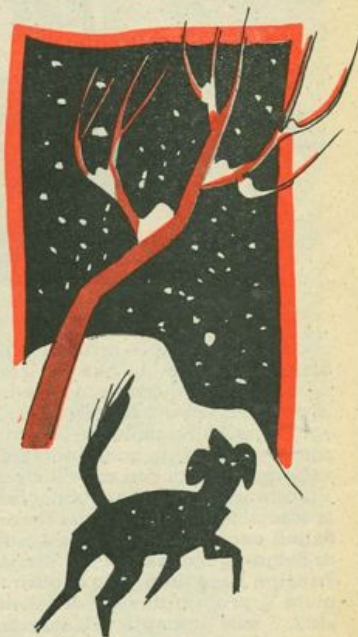
... l'animale sussultando si scrollò con un nuovo e più acuto gemito...