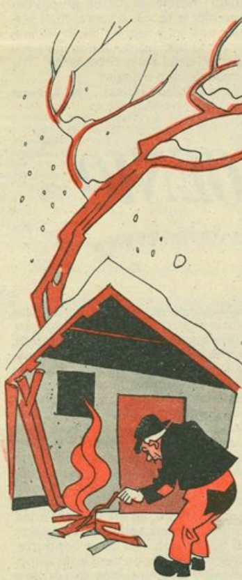
... vide un vecchio che cercava di alimentare un focherello di sterpi...

sfolgoranti di lumini e di strisce d'argento, vide uomini intorno a tavole imbandite, coppie che danzavano al suono di musiche allegre, vecchi seduti che parlavano dei loro ricordi.