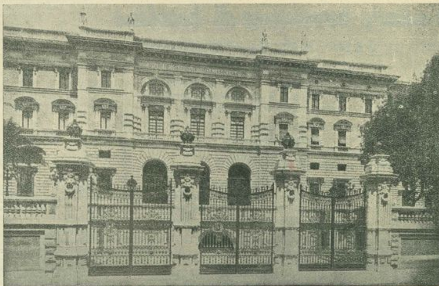
Sede e Direzione Generale dell'ISTITUTO NAZIONALE DELLE ASSICURAZIONI - Via Sallustiana - ROMA

Società collegata con l'Istituto Nazionale delle Assicurazioni il quale garantisce integralmente le Polizze