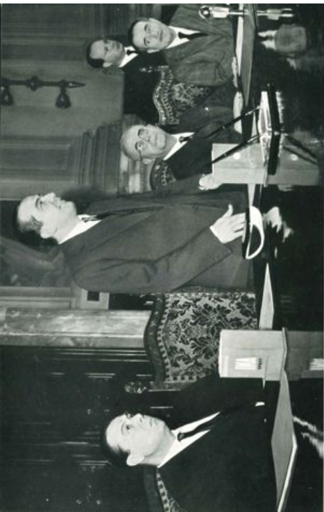
Il Presidente del Comitato Organizzatore dei Giochi della XVII Olimpiade ringrazia gli Amministratori dell'INA, A. nel corso della cerimonia per la consegna della polizza.