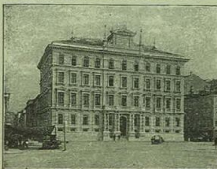
Trieste, Via della Stazione N. 888-I.

Danni pagati nell'anno 1896 f. 9,890,288.74