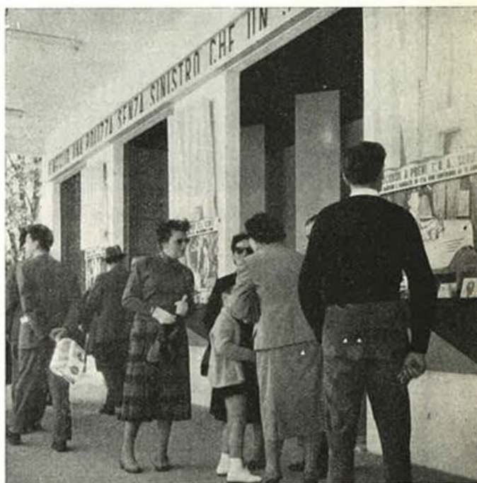
IL CONCORSO INA-SCUOLA IN FUNZIONE