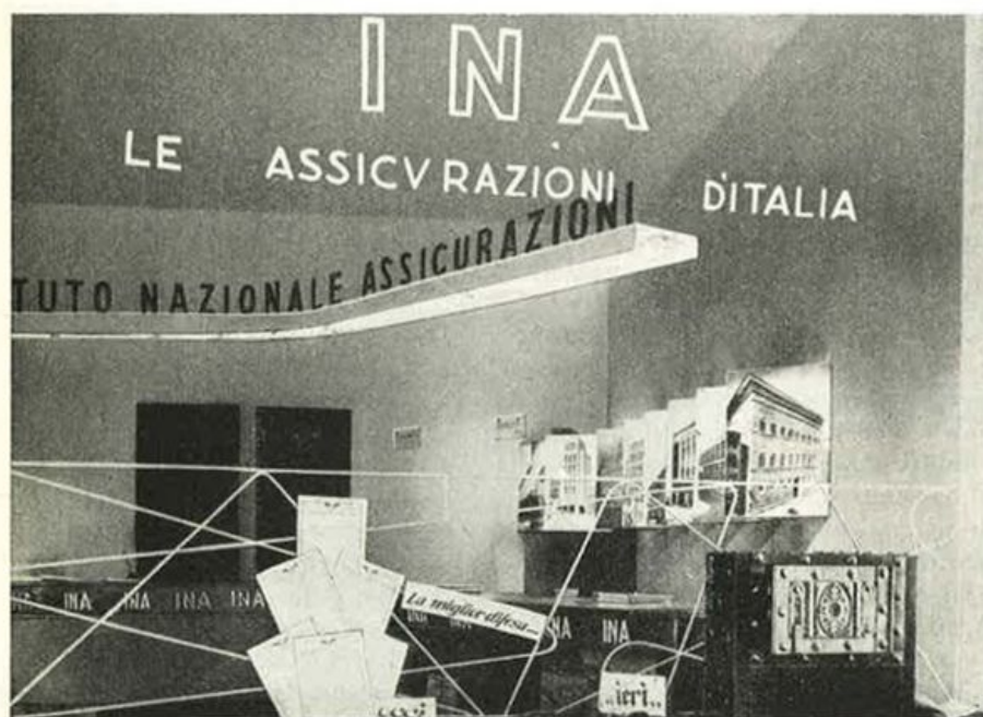
UNA SUGGERITIVA VETRINA DELL'AGENZIA GENERALE DI TORINO

Contiamo quindi sullo spirito di iniziativa di tutte le Agenzie Generali perchè, in nobile gara, possano seguire l'esempio delle consorelle citate, potenziando sempre più efficacemente le finalità che il Gruppo I. N. A. persegue.