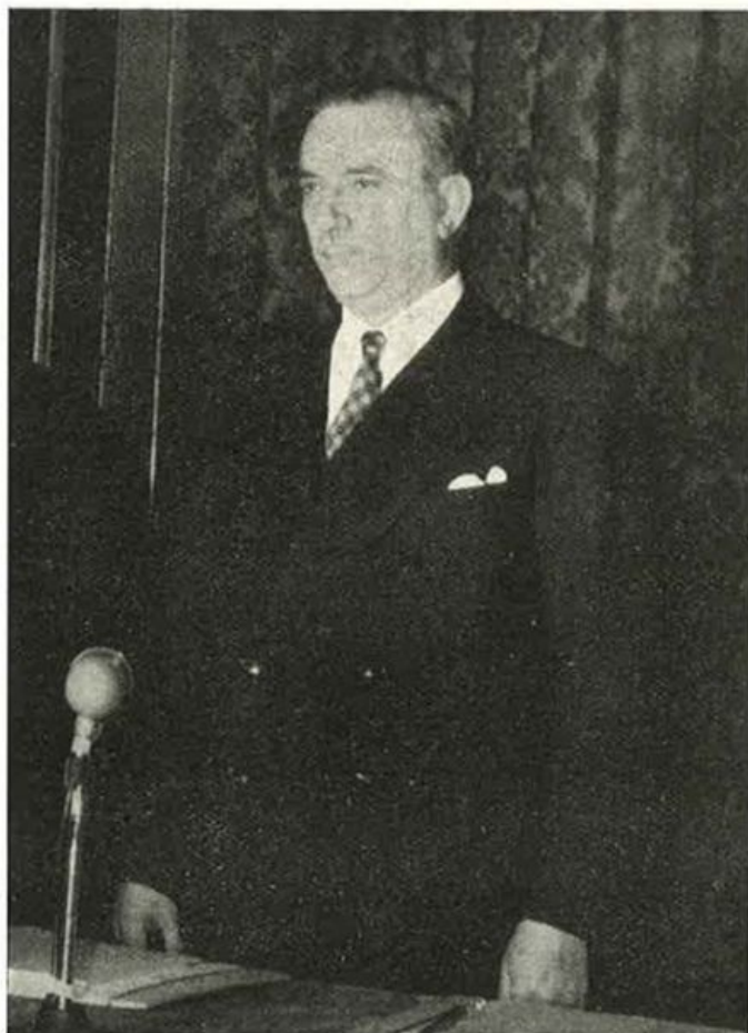
IL MINISTRO CAMPILLI ALLA INAUGURAZIONE DEI LAVORI

Il 5 ed il 6 marzo u. s. ha avuto luogo a Bruxelles, i delegati francesi, belgi ed italiani hanno presentato una nota comune sulla creazione di un organo di collegamento che possa attuare la più stretta collaborazione fra le Associazioni assicurative dei Paesi europei. La nota, ampiamente dibattuta e vigorosamente sostenuta dal prof. Sacerdoti, è stata infine approvata. L'organo di collegamento sarà denominato «Comitato europeo di assicurazioni» e la sua presidenza tenuta a turno su designazione dell'Assemblea plenaria. Il nuovo organismo sarà inizialmente presieduto dalla nostra Associazione Nazionale fra le Imprese Assicuratrici cui tale incarico è stato affidato per acclamazione.