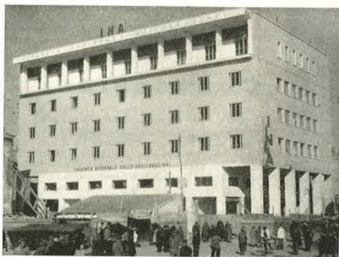
BARLETTA - Piazza Roma - Palazzo per ne- gozi, uffici, apparta- menti