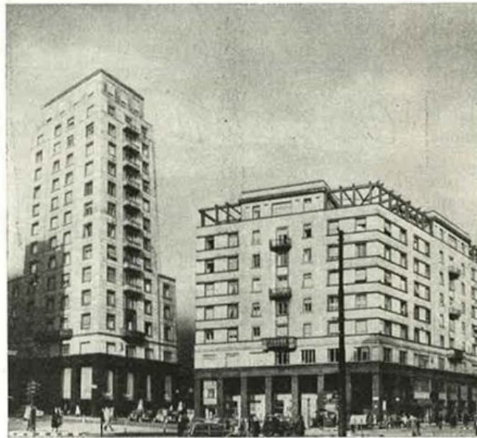
Nel marzo del corrente anno l'Istituto Nazionale delle Assicurazioni ha effettuato l'acquisto di un importantissimo complesso immobiliare in Milano, nella zona di San Babila.

In questo numero abbiamo voluto soltanto gettare uno sguardo fuggitivo alle operazioni d'investimento più recenti. Nei prossimi, illustreremo in dettaglio quelle di maggior rilievo.