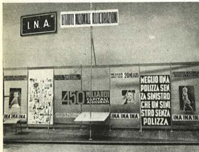
LO STAND I.N.A. AL SALONE AUTO TORINO

A parte l'impostazione del tutto originale, il nostro stand si è presentato sotto una veste di signorilità ed eleganza che molto si addice all'ambiente del Salone Internazionale Auto di Torino.