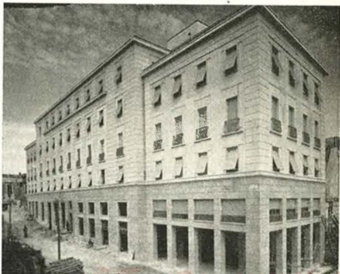
BRINDISI - Via Mat- teotti - Palazzo per ne- gozi, uffici, apparta- menti.