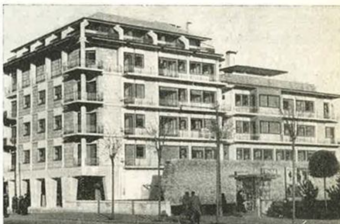
TREVISO - Via Roma Palazzo per negozi, uffici, appartamenti.