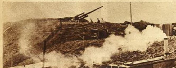
Una batteria contraerea nella testa di ponte del Cuban.

Tra le rovine della propria casa, distrutta dai bombardamenti sovietici, questa contadina fa ricerca delle provviste alimentari.