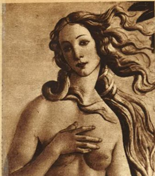
Firenze - Botticelli: La nascita di Venere (dettaglio).

Gualtiero era quasi sempre assopito. Ma nel delirio e nei brevi momenti di lucidità, dalle sue labbra non usciva che un nome: