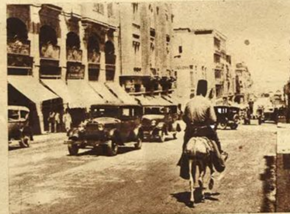
Siria - Una via di Beirut.

Affacciata al Mediterraneo, la Siria fu da tempo immemorabile aperta alle influenze dell'Occidente, in modo particolare a quelle cristiane: italiane e francesi. E ciò giovò alla sua evoluzione culturale.