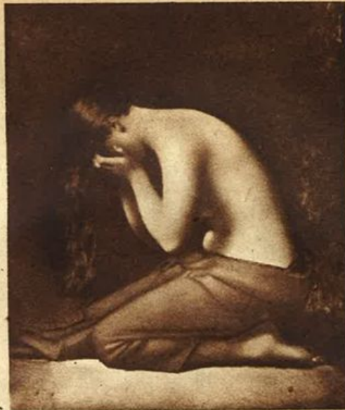
Parigi - J. J. Henner: Maddalena.

Risposta: Per il matrimonio di una figlia, quando i genitori siano entrambi assicurati, non è ammesso il cumulo di due assegni. Nel caso che l'assegno sia richiesto contemporaneamente da entrambi i genitori, l'assegno è corrisposto al padre.