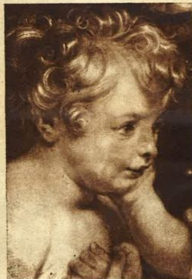
Firenze - Rubens: Sagra Famiglia - S. Giovanni (dettaglio). (Anderson).

L'utilizzazione del capello non è una novità. Basta riflettere sulla analogia di proprietà e di struttura esistente tra i peli degli animali e i capelli, per riconoscere anche alla capigliatura dell'uomo la possibilità di pratiche utilizzazioni tecnico-industriali. La fibra della lana, infatti, è costituita essenzialmente da una sostanza azotata di natura proteica, la cheratina, la quale si trova nei capelli dell'uomo, come anche nei peli, nelle piume, nelle corna e nelle unghie di tutti gli animali. Così il manto pilifero