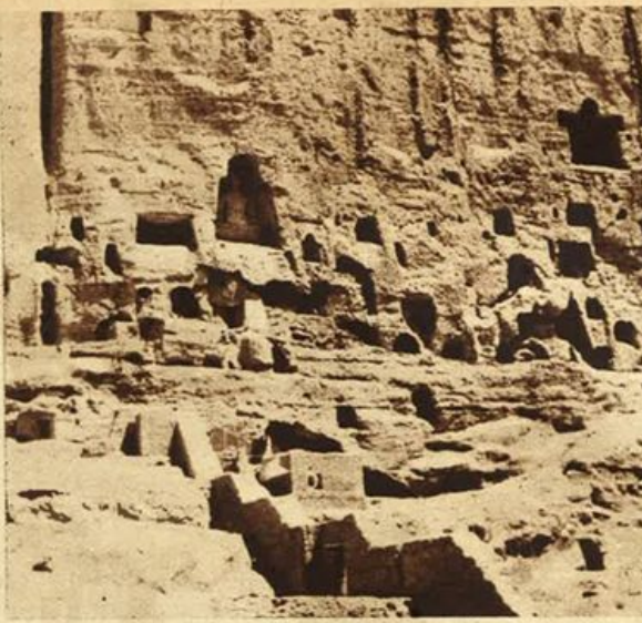
Afganistan - Abitazioni scavate nella roccia.

l'Irak, l'Iran e la Turchia, in perfetto accordo, concludevano il patto di Saadabad, che stabiliva la reciproca cooperazione in caso di attacco da parte di Stati esteri. Ma le vicende che hanno ora travolto la politica dell'Iran e dell'Irak hanno tolto a questo accordo ogni valore.