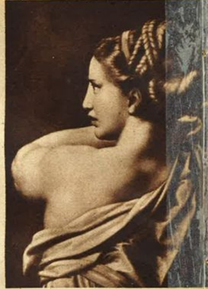
Roma - Raffaello: Particolare della Trasfigurazione.