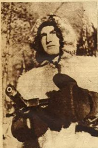
Fante tedesco nella zona del lago Ladoga.

Tra le rovine della propria casa, distrutta dai bombardamenti sovietici, questa contadina fa ricerca delle provviste alimentari.