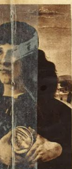
Botticelli: Piero de' Medici. (Anderson).

deve quindi essere considerato una vera fibra tessile, da mescolare ad altre fibre autarchiche (lanital, fiocco ecc.). Per cui impiegando razionalmente il notevole contingente di capelli oggi disponibili sul mercato, si verrebbe, oltre ad utilizzare del materiale che prima, in gran parte, veniva sistematicamente sottratto all'economia del Paese mediante distruzione, a limitare il consumo di altre fibre che, se pure autarchiche, per determinati quantitativi devono essere riservate alle Forze Armate. Questo è il significato della campagna per il ricupero dei capelli. Ne consegue allora che le nostre chiome, bionde o brune, ondulate crespe o lisce, le trecce che le nostre donne conservano a ricordo, gli umili capelli che al mattino restano tra i denti del pettine, acquistano di colpo ai nostri occhi la consistenza di una potenziale riserva di materia prima che, razionalmente sfruttata, rappresenta per la nazione in guerra una non trascurabile risorsa ed una forza. Nell'anno di guerra 1943 il mito di Sansone rinverdisce!