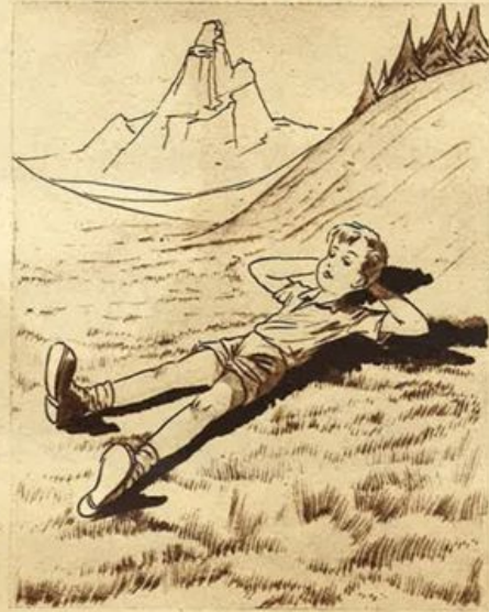
Sulla sua testa c'era il cielo... cielo turchino tutto luminoso...

geva al petto, inebriato di profumo. Saliva, saliva. Il viottolo non era più levigato adesso; ma aveva anzi punte di sasso sporgenti e buche e scoscendimenti. Le gambine del bimbo vacillavano talvolta, quando i piedini urtavano i sassi o franavano nelle buche. Gli caddero i fiori e lui li raccolse, ché ai margini oramai non vi erano più che rovi arguti di spine e a voler coglie-