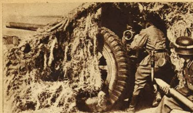
Cannone mascherato a guardia della costa atlantica.