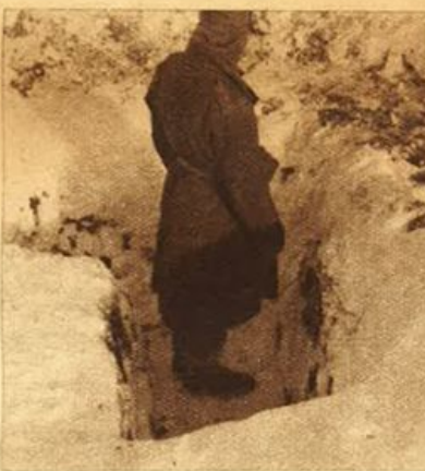
Posizione avanzata sul fronte russo tenuta dalle nostre truppe.