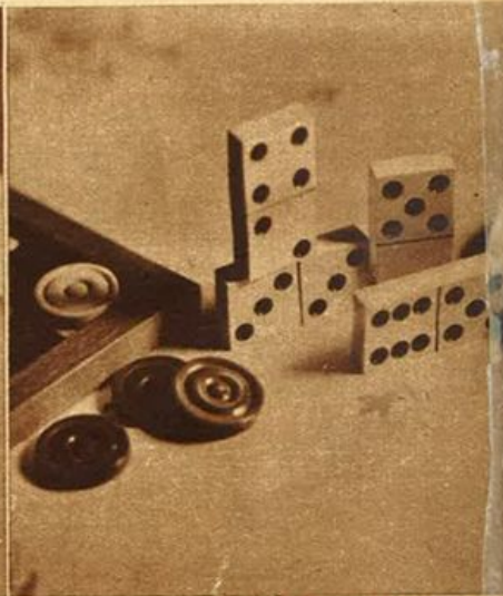
Oggetti in galatite.