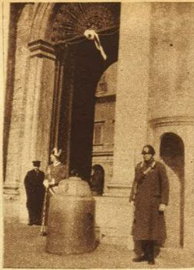
« Nastro bianco » al Quirinale per la nascita della Principissima Beatrice di Casa Savoia.

Se il mese di febbraio potesse rivelare le beffe maligne, qualche volta tragiche, che al gelido soffio della tramontana e col malvagio passaporto carnevalesco, uomini e donne ordirono ai loro nemici ci si rizzerebbero i capelli sulla testa. Non c'è quindi da stupirsi se gli Emiliani, in un vecchio proverbio, affermassero: « Dietro la maschera c'è un volto di bandito ». Prese nel vortice della follia, fatte audaci dall'impunità, le creature umane, spesso, si trasformano in belve. Il varipinto sparito delle maschere, dei confettini colorati, dei coriandoli, copriva le gesta più losche, i