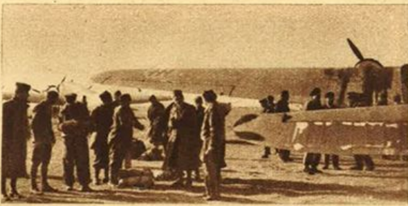
Tunisia - Sbarco di nostri reparti trasportati per via aerea.