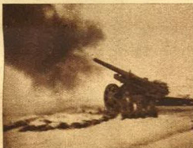
Fronte Orientale - Concentramento di fuoco sul nemico.