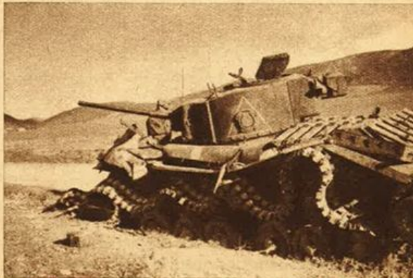
Mezzi corazzati americani distrutti dalle nostre truppe in Tunisia.