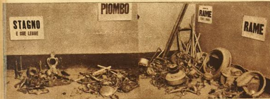
Una sala del Museo delle cose vive: questo materiale raccolto dagli scolari d'Italia verrà utilizzato per la fabbricazione di armi per i nostri soldati.

eccò i reparti del museo, e ogni reparto aduna in farraginosa ma pittoresca raccolta le cose più disparate: colonne di vecchi giornali si elevano vicino a mucchi di rottami di ferro, frammenti di tubazioni di piombo giacciono accanto a vecchie lucerne di rame, fornelli di ghisa e utensili da cucina fuori uso, oggetti minuti a fianco di intere ossature, ancora valide, di letti metallici.