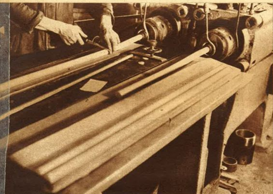
Dalla pressa esce una sbarra di galalite.