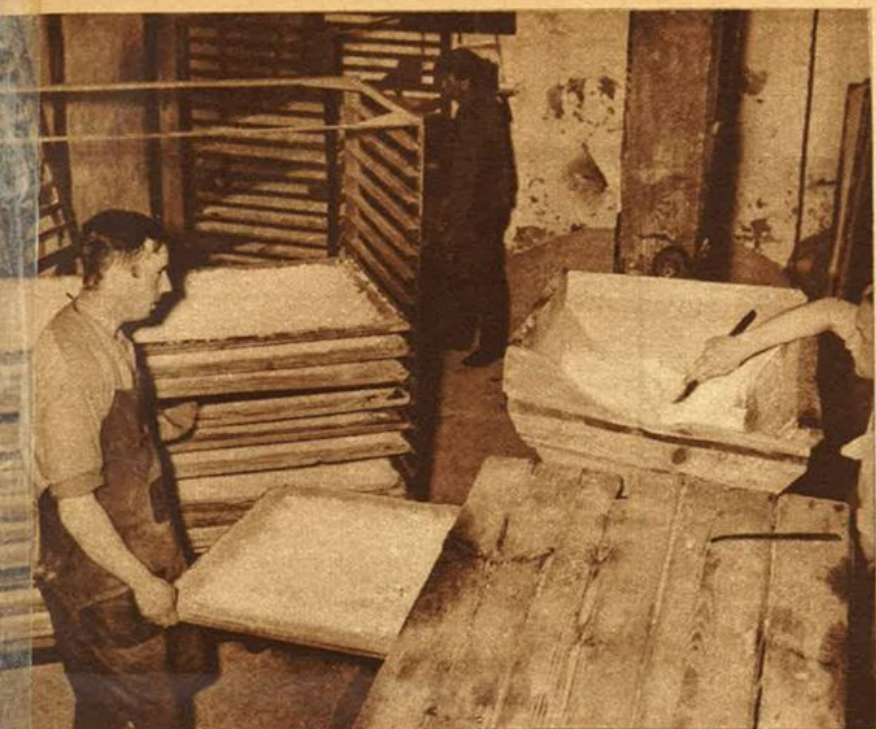
L'essiccamento della materia-prima dalla quale si ottiene poi la galalite.