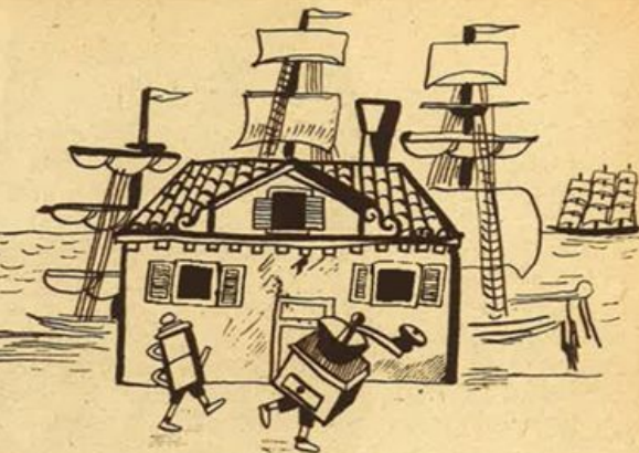
...la casa è un porto di mare...

ogni istante, senza una tregua; deve organizzare la sua raccolta, sorvegliare che nulla finisca nella spazzatura, darsi un metodo, abituarsi in una parola ad essere un elemento produttivo, fino all'acquisto di una educazione e di una disciplina di ordine nei ricupero, utile a sé e alla Patria.