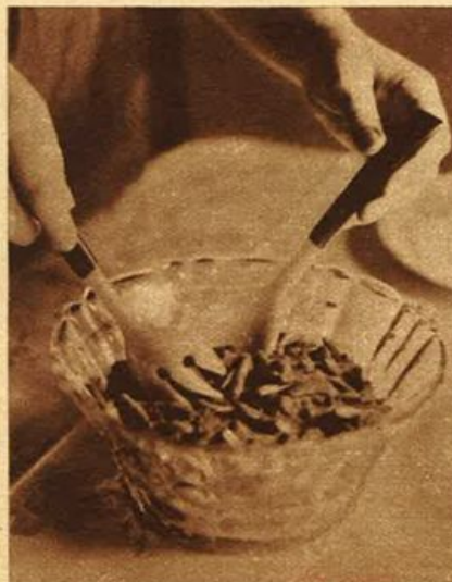
Posate da insalata di galatite.

Chi infatti ha dimenticato il famoso « lanital », anch'esso ottenuto dalla caseina e dovuto all'inesauribile genio inventivo di un figlio di questa nostra grande e amata Italia?