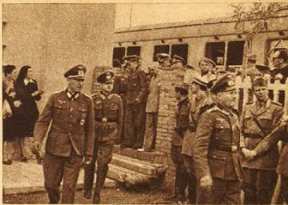
Riccione - L'arrivo di 150 ufficiali tedeschi feriti di guerra, ospitati nelle colonie italiane.