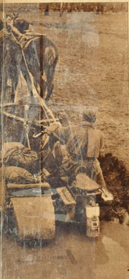
Una coppia di cavalli attraverso terreno polidoso.

dal cannone scetticismo inglese fran- zi da guerra. oni di alsazia, ai dei Pirenei, i bouviers, che di volta in volta sanno diventare preziose staffette, agenti di collegamento, stendifili, cani sanitari, cani da irincea, derattizzatori. Nella storia della guerra sono segnati centinaia di nomi di eroi canini.