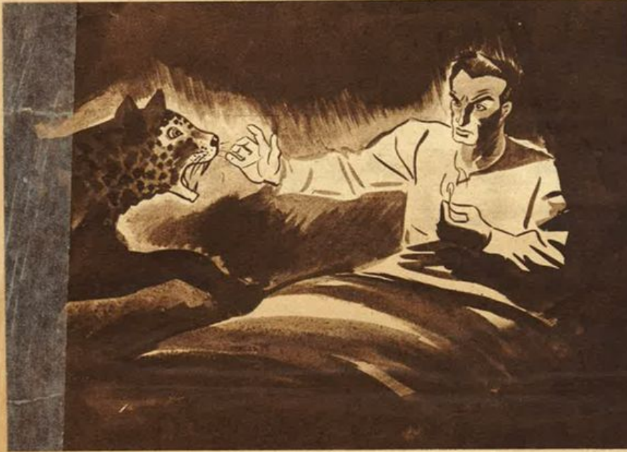
... vidi un muso ferino orribile, due occhi verdastri, una bocca biancheggiante di zanne aguzze...

Ero pronto a strofinare le capocchie sul ruvido della scatola... Diretti lo sguardo dove presumevo fosse fermo il ladruncolo... Esitai un attimo ancora, poi « zaff »!