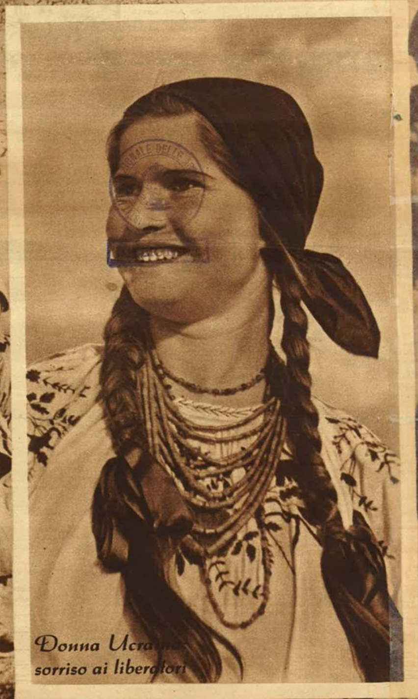
Donna Ucraina sorriso ai liberatori