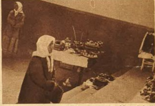
La fede religiosa ritorna nella Russia liberata - Offerta di frutta e fiori alle sacre icone.

Per chi crede all'esistenza eterna di oltretomba e per chi non vi crede, i morti sono vivi. Risplendono nel cuore di quelli che li amano, si muovono, si agitano e soffrono nel ricordo dei parenti e degli amici. Popoli d'ogni razza, d'ogni epoca non considerano mai il trapasso come un implacabile, definitivo distacco delle persone care. Un filo luminoso di memorie e di affetti unisce all'inquietudine dei vivi il solenne enigma dei morti. Sempre, i morti, si sono onorati. In modo bizzarro, presso gli uomini primitivi, con complicazione di cerimonie, in Oriente, con dignità severa nel nostro mondo civile. Il popolo caldo, rude, materialista, affannato, di continuo, nella ricerca di gioie terrene, chiamava i morti « coloro che guardano ». C'era la certezza che i defunti, liberi del corpo e, quindi, di ogni egoistica sollecitudine, osservavano, di continuo, i vivi amati. E i vivi facevano in modo che i loro gesti, le loro parole, anche i loro pensieri potessero soddisfare il padre, la madre, la sposa, il fratello morti. Avveniva, molte volte, che la scomparsa di una per-