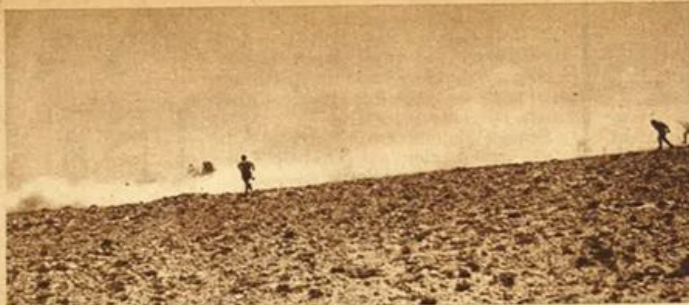
Fronte egiziano - Contrattacchi di nostri reparti.