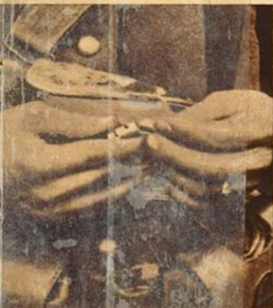
Il colombo viaggiatore.