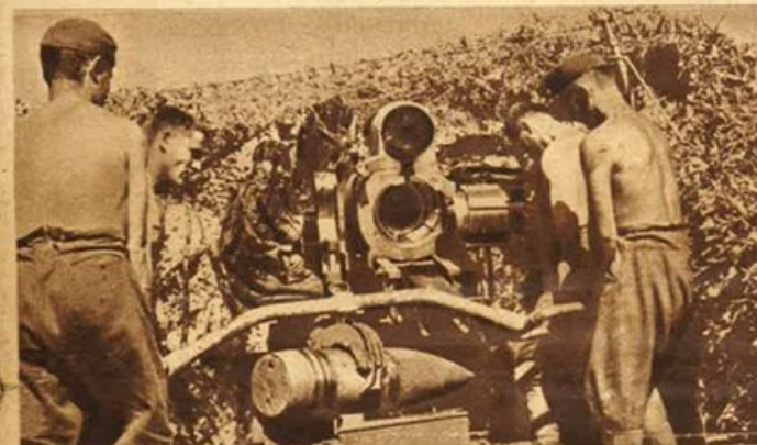
Fronte orientale - Artiglieria pesante in azione.