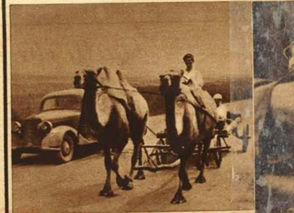
Dromedari adibiti al trasporto di rifornimenti nei settori meridionali del fronte orientale.

Trentacinquemila cani, sviluppo della prima regolare precettazione di semila cani da guerra, usarono i tedeschi nella guerra del '14. I russi già nella guerra contro il Giappone avevano fatto larghissimo uso dei cani sanitari. Nel servizio di avanscoperta e di vedetta superano l'esploratore e la sentinella più accorta, distanziandola di gran lunga per l'acutezza dei sensi, Servigi grandiosi rendono nel collegamento di reparti isolati, recando messaggi e stendendo linee telefoniche e