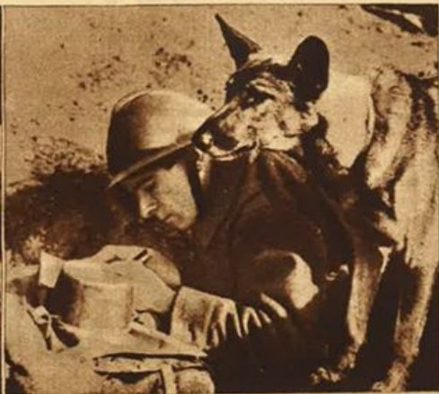
Il cane pronto a compiere la sua missione.