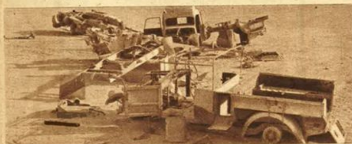
Automezzi britannici distrutti dalla nostra aviazione sul fronte egiziano.