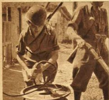
Fronte orientale - Nostri genieri stabiliscono i collegamenti telefonici.