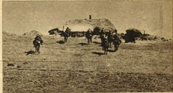
Reparti di cavalleria dell'ARM. I.R. eliminano alcuni centri di resistenza nemica sul fronte del Denez.