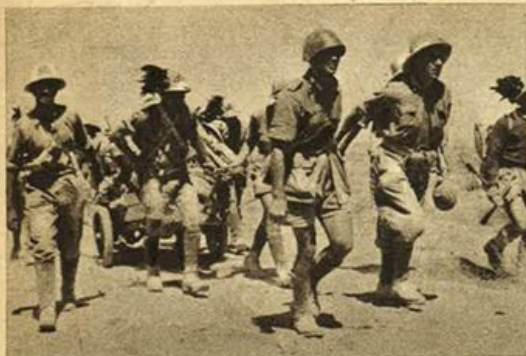
Nostrì reparti di bersaglieri in territorio egiziano.