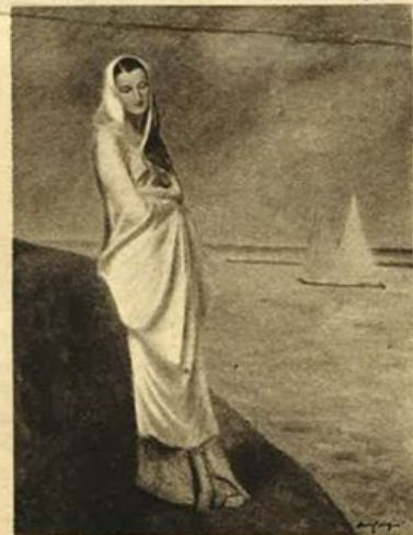
Aldo Carpi - Figura in bianco.

Tutti conoscono la pittura di De Pisis: rapida, immediata, tirata giù con una inesauribile parlantina. Forse hanno bisogno di molta luce le pennellate trillate; per cui il chiuso delle sale veneziane mette