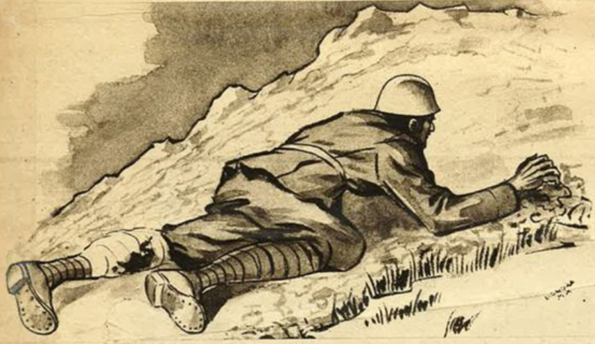
...si trascinò carponi...

esplosivo e messa al sicuro proprio sotto la roccia. Forse c'erano delle altre cose, ma in quell'oscurità, girando intorno lo sguardo, Lizzi non vedeva altro. Stringeva i denti per non sentire il dolore e a poco a poco, così disteso e coperto dal cappotto e da un telone messi a mo' di coperte, un leggero torpore cominciò ad assalirlo. Chi sa? Forse era effetto della febbre... Tendeva l'orecchio ad ogni rumore che il vento gli recava, cercava di seguire mentalmente il progredire del lavoro dei compagni. Oh, come avrebbe voluto essere ancora con loro! Ma anche così gli pareva di poterli incitare col pensiero, gli pareva di poter coadiuvare in qualche modo alla loro opera, gli pareva... Un rumore che nulla aveva in comune con quelli uditi fino a quel momento, colpì il suo orecchio. Forse era un ramo rotto... Che c'è di strano in un ramo rotto durante una notte di vento? Nulla, eppure quel rumore ferì stranamente il suo orecchio, mise in subbuglio tutto il suo spirito. E nella grande tensione nervosa in cui si trovava, dopo quel primo rumore il caporale ne percepì un altro e un altro. Era chiaro: qualcuno avanzava verso di lui da una parte da cui nessuno avrebbe dovuto giungere. Come era possibile questo? Non se lo chiese, ma ebbe la certezza che qualcosa stava per accadere, ebbe l'intuizione che qualcosa di grave si stava preparando alle spalle dei compagni suoi ignari. Allora si scosse e con uno sforzo si levò a sedere. Quelle rocce formavano una