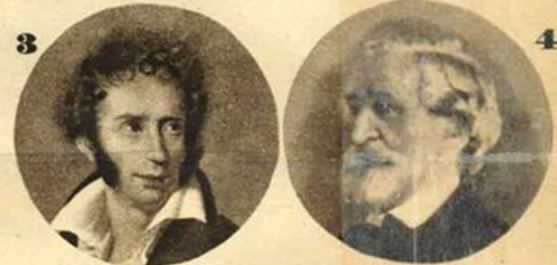
RISULTATI DEL CONCORSO DEL MESE DI GIUGNO 1942-XX:

b) Indicare a quale poeta, pittore, eroe, ecc. si riferiscono le seguenti fotografie: