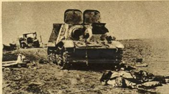
Sono rimasti sul terreno i segni della vittoriosa azione delle nostre truppe oltre il bacino del Denez.