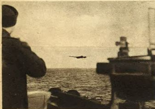
Sopra: Nostrè unità da guerra della marina nel Mediterraneo centrale - nel cielo vigilano nostrì aerei.