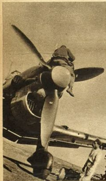
A sinistra: Nostrì apparecchi di ritorno da un'azione contro gli obiettivì nemici.