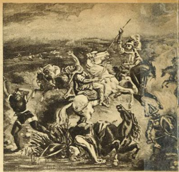
Giorgio De Chirico - Combattimento.

Come squillava la tromba! Qualcosa di decisivo e di solenne era in