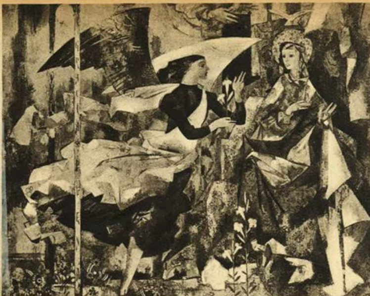
Ungheria - Giulio Ricuz - Annunciazione.