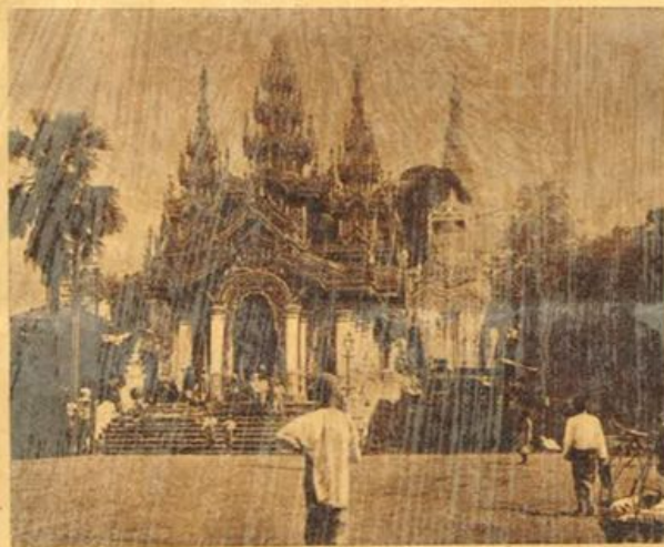
La grande pagoda di Siva a Rangoon

Anche questo fu un grande errore degli alleati anglo-americani,