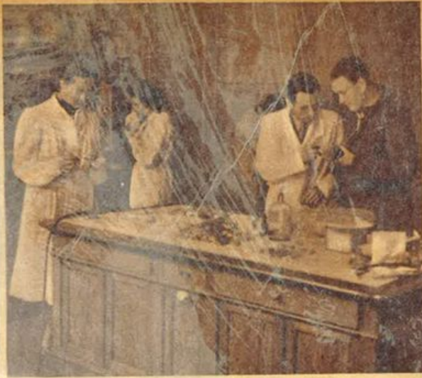
I trapianti dei microorganismi in culture pure.