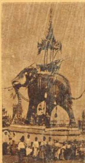
Mandalay - I funerali di un bonzo buddista, che giace entro il sarcofago in forma di elefante, presentato sempre uno spettacolo di ricchezza e di fasto.