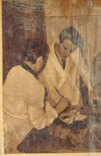
Misurazioni con l'ago microtermoelettrico.

Non è possibile dire di una « clinica delle piante », senza voler cercare di chiarire prima di tutto, una questione delicata e nello stesso tempo interessante, quella cioè dei rapporti fra la fitopatologia (patologia delle piante) e la medicina umana.