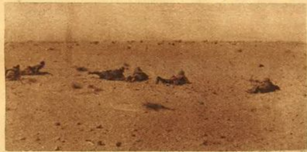
Africa settentrionale - Attacco di nostre truppe alle posizioni nemiche.