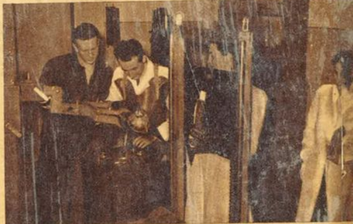
Diagnosi coi raggi X.