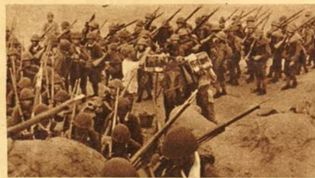
Una sosta delle truppe giapponesi in Birmania dopo la vittoriosa avanzata.