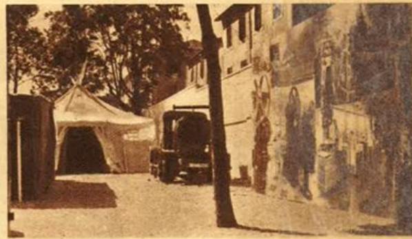
Roma - In occasione del Convegno per la chirurgia di guerra è stata allestita alla Città Universitaria una Mostra del materiale sanitario.

sapere al monaco che io desidero acquistarlo a qualunque prezzo. Domani parte un corriere per Firenze... Scrivetelo.