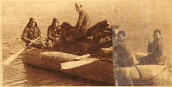
Sui fiumi russi sgelati nostri bersaglieri navigano su canotti pneumatici.