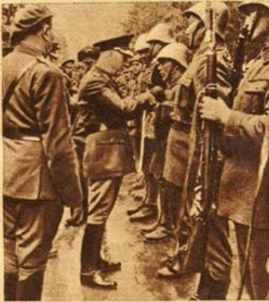
Il maresciallo Antonescu consegna le decorazioni alle truppe rumene che operano in Crimea.