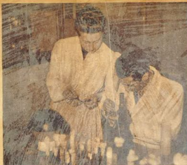
L'esame macro e microscopico di un rametto di abete ammalato.