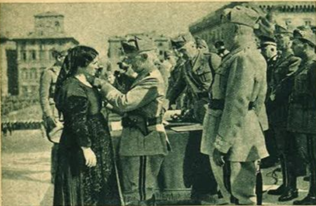
La celebrazione della Giornata dell'Esercito e dell'Impero - Il Sovrano consegna le Medaglie d'Oro "alla memoria" ai familiari di eroici caduti.