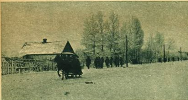
Fronte russo - Nostri reparti in marcia verso le posizioni avanzate.