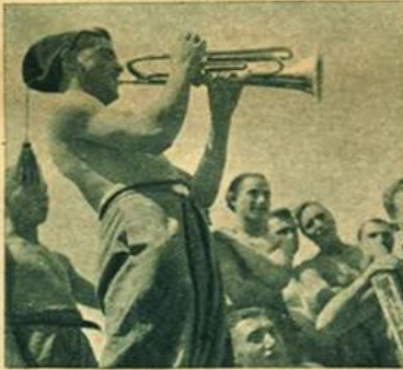
Giovani Fascisti combattenti in A. S. - Un po' di musica nei momenti di sosta.