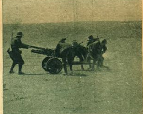
Africa Settentrionale - Messa in postazione di un cannone anticarro.

Al fascino del mese fiorito non sfuggono neanche i seguaci di Marte. Si dice che il celebre condottiere Braccio da Montone una volta, in maggio, vinto dalla dolcezza di un patetico tramonto, scriveva una poesia in lode delle roselline. La poesia, certo con poco danno per la letteratura, andò perduta; forse fu l'armigero stesso che la disperse, ma restò poi, al versaiolo, un nomignolo assolutamente in antagonismo con la sua attività bellica: «cantor dei giardini».