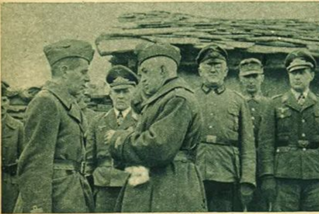
Fronte russo - Consegna di ricompense al valore sul campo a ufficiali e soldati italiani e tedeschi.