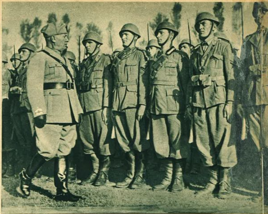
Il Duce passa in rivista le truppe.