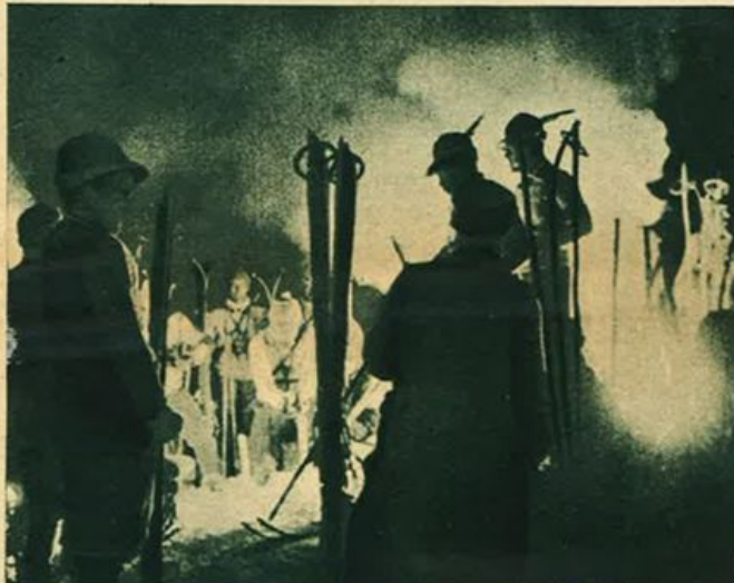
I nostri alpini.