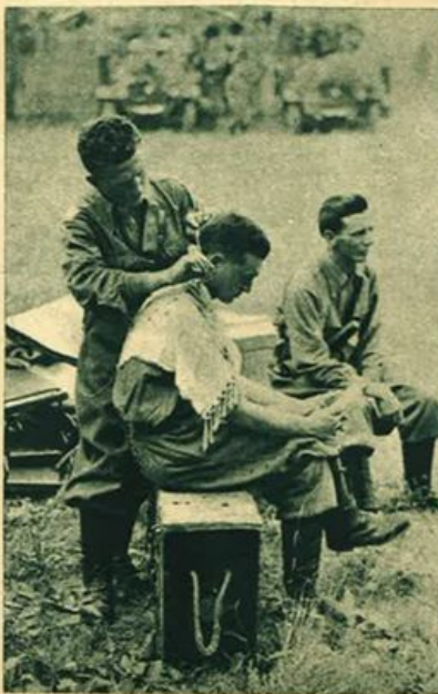
Il taglio dei capelli.