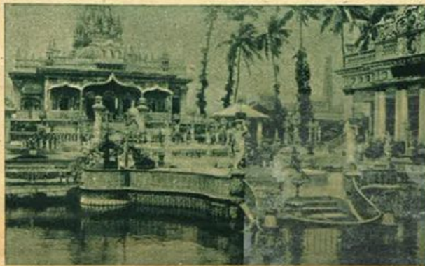
Il Tempio di Janis.

zione dell'anno precedente) — siamo stati cacciati dalla Cirenaica, dove ci siamo soltanto ora in parte ristabiliti; siamo stati cacciati dalla Grecia e da Creta; siamo stati attaccati da nuovi, freschi e formidabili nemici nell'Estremo Oriente; Hong-Kong è caduta; la penisola della Malacca ed i possedimenti dei nostri coraggiosi alleati olandesi nelle Indie Orientali sono stati invasi; Singapore è stata la scena del più grande disastro dell'esercito britannico che la storia ricordi; le squadre alleate, nelle Indie Orientali Olandesi, sono state virtualmente distrutte nell'azione di Giava; la Birmania è invasa; Rangun è caduta; una violenta battaglia è in corso nell'Alta Birmania; l'Australia è minacciata; l'India è minacciata; la bat-