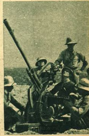
In Africa Settentrionale - Mitragliatrice contraree in azione.