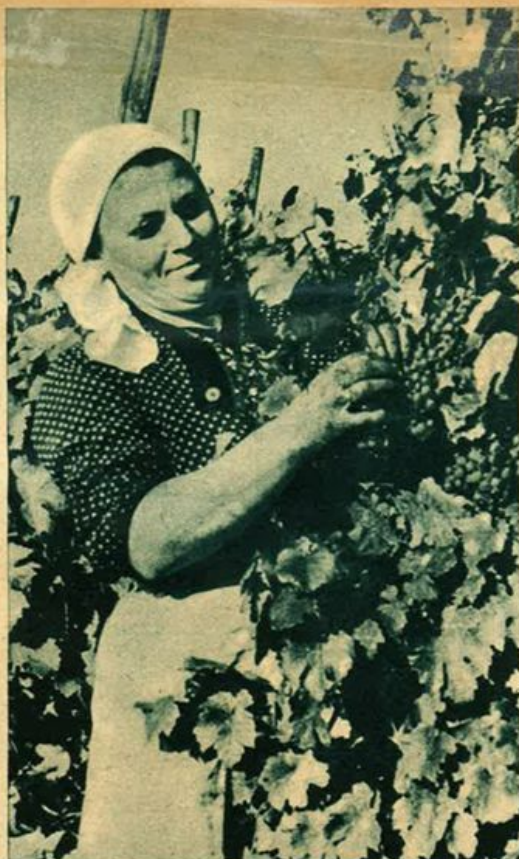
Un buon raccolto dell'uva com'era stato previsto dall'infiorescenza dell'"arum maculatum".

virtù ad essa attribuite dai contadini, ma anche per le gravi conseguenze a cui andrebbero incontro coloro i quali dovessero usarla in qualche modo.