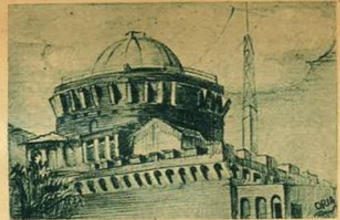
L'autor che tanto bello nominò ma più no tralasciò per brevità, è nel dubbio se aggiungere qui o no quella grande, minuscola città ch'è colma di tesori e la dà sé, con leggi proprie e con un proprio re,