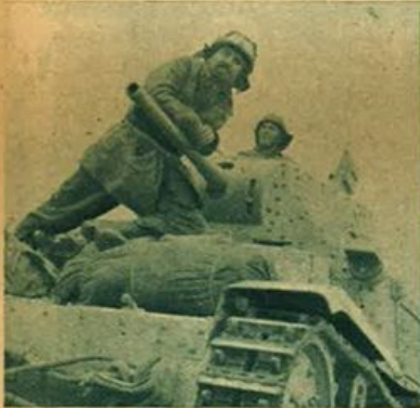
L'eroica Divisione Ariete.