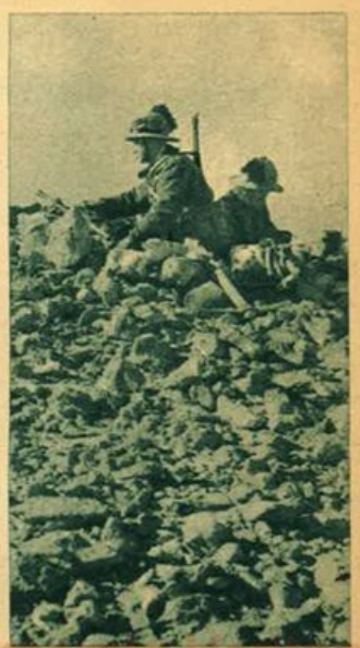
Appostamento italiano in A. S.