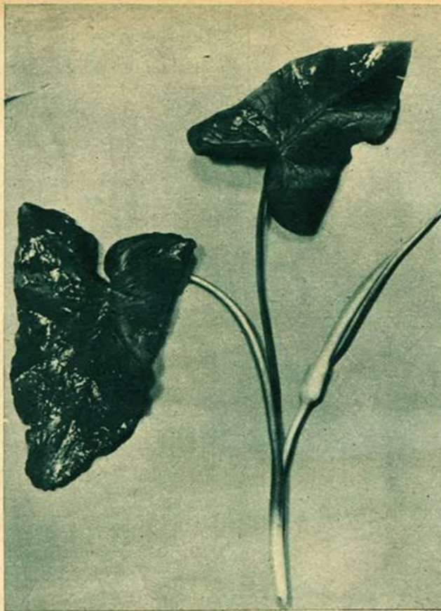
"Arum-maculatum" cresce nei terreni umidi e sulle rive dei ruscelli.