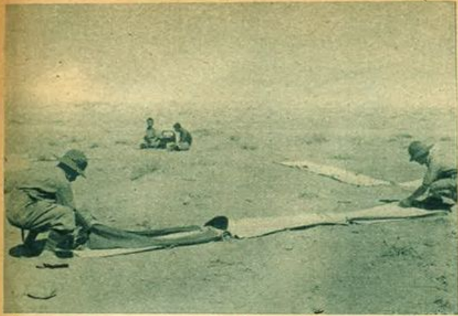
In un nostro campo d'aviazione in Africa Settentrionale. Segnalazioni per aerei.