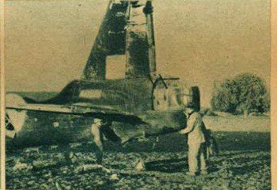
Bombardiere "Wellington" che la caccia ha costretto ad atterrare nei pressi di Modica (Bollettino N. 626).