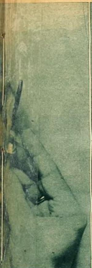
La pianta profeta dell'infiorescenza.