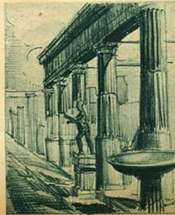
Gli due millenni dura l'atroce sepoltura; ma allin, scosso il sudario, dal velo funerario erge la sua figura nuda, pagana, pura. Lì presso un santuario: La Vergine del Rosario.