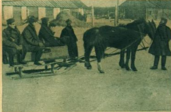
Sul Fronte Orientale - Ufficiali dei bersaglieri mentre si recano in slitta a ispezionare le linee.