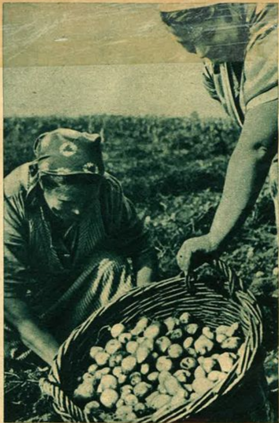
Un ottimo raccolto di patate com'era stata prevista.

In nessuna categoria di persone come nel contadino si affardano usanze e credenze che possono sembrare ormai superate dal tempo e dalle audaci conquiste della civiltà.