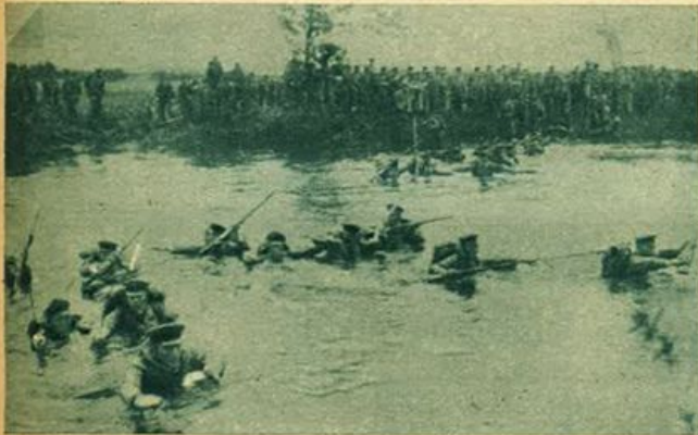
Nella penisola di Malacca - Fanti nipponici completamente equipaggiati mentre guadagnano un fiume in territorio nemico.