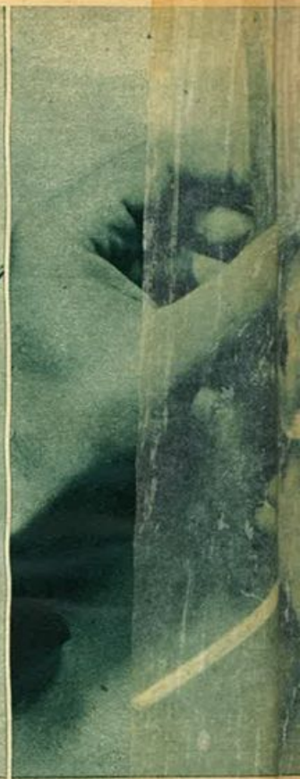
Apprendo le foglie appare la fiora