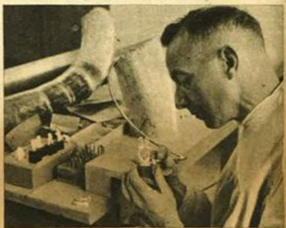
Scultore in avorio di Erbach (foresta dell'Oder) che sta intagliando un gruppo di ciego.