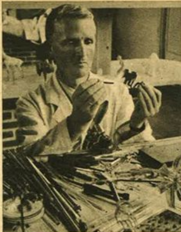
Elefante soffiato nel vetro da un artigiano delle foreste della Turingia.

dicesimo secolo gli abitanti di quel villaggio bavarese erano dediti all'intaglio in legno, la cui produzione, per altro, si limitava ad oggetti d'uso domestico.