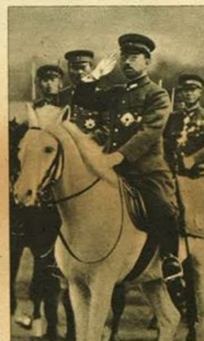
L'imperatore del Giappone passa in rivista le truppe di Tokio.

dustria, il malcontento cominciava a serpeggiare fra il popolo; ma la fine delle vecchie istituzioni fu segnata dall'arrivo del Capitano Perry all'arcipelago del Giappone. Egli, giunto in prossimità di quelle coste con una flotta degli Stati Uniti, tentò di indurre il Governo a rompere le barriere che isolavano l'arcipelago dal resto del mondo. Nel 1854, infatti, gli Stati Uniti conclusero un trattato commerciale col Giappone. Questa prima breccia parve d'un tratto rovinare tutto l'edificio eretto dagli Sciogun. Sorse una guerra civile: da una parte i seguaci degli Sciogun, rigidi conservatori, dall'altra i partigiani del Mikado, sorretto dal popolo, anelanti di riforme, desiderosi di intraprendere rapporti con altri popoli del mondo. La vittoria del Mikado segnò la fine dei vecchi siste-