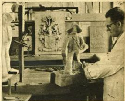
Scultore in legno al lavoro d'intaglio (a sinistra il modello in gesso).