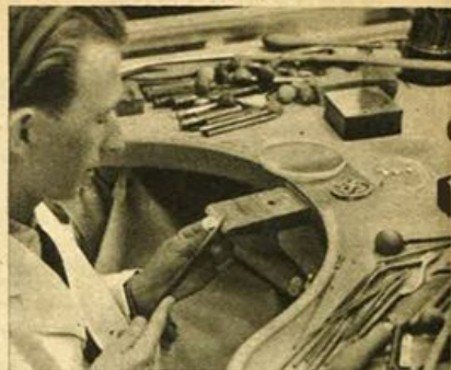
Gioielliere mentre taglia un gioiello (Pforzheim).

Ma anche in mani, molto più modeste la scultura in legno ha nella Germania un ruolo ragguardevole: bei lavori d'intaglio e di scultura in legno sono un altro vanto dell'artigianato tedesco. Specialmente un piccolo famoso centro, quello di Oberammergau, può menare un tale vanto. Fin dal do-