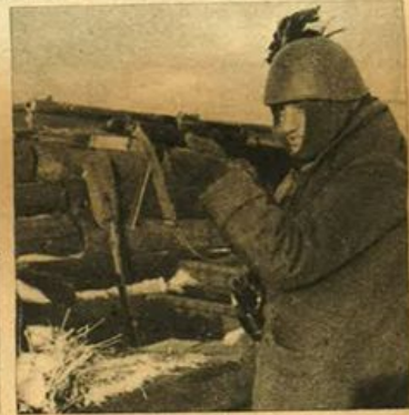
Un nostro bersagliere fa una postazione avanzata sul fronte russo.