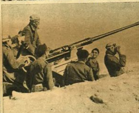
Africa Settentrionale. Giovani fascisti sulle posizioni avanzate, aprono il fuoco coi cannoni anticarro.