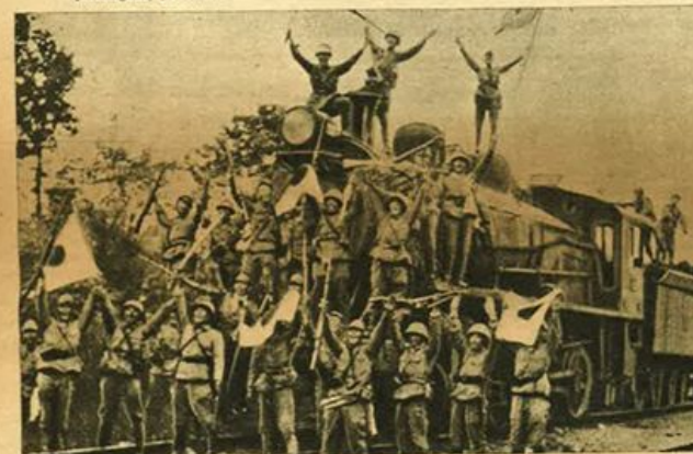
Reparti nipponici che inneggiano alla vittoria dopo la conquista di un treno nemico.