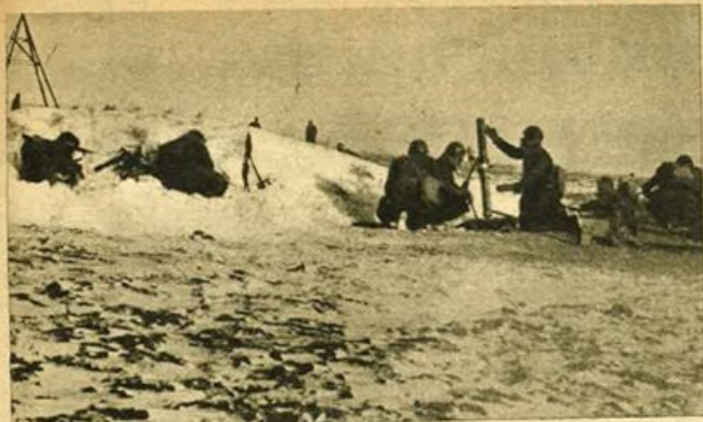
Mortal d'accompagnamento delle nostre forze durante la conquista di quota 222 sul fronte russo.