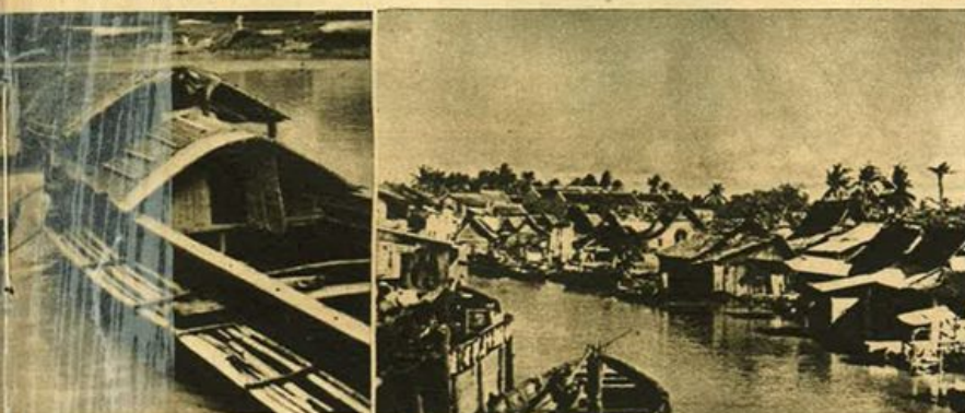
Malacca - Il quartiere malese.

Ogni famiglia deve possedere almeno una polizza dell'Istituto, così, anche in questo campo, l'Italia potrà affermare, con orgoglio, di aver raggiunto un grande primato.