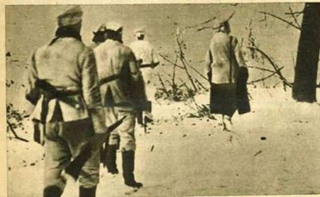
I reparti tedeschi di prima linea sul fronte russo eseguono frequenti e ardithe pattuglie, preludio ad azione di annientamento delle forze bolsceviche.