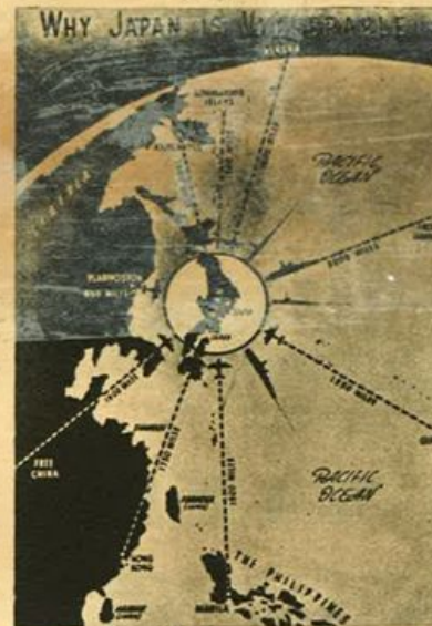
La vulnerabilità del Giappone secondo quanto pubblicava la stampa americana.

Vi sono grandi industrie per la lavorazione del cotone; cotonifici, jutfici, lanifici, setifici; industrie ferroviarie, fabbricazione della carta, prodotti chimici, oli essenziali, cuoio, saponi.