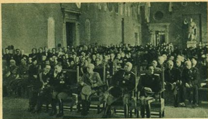
S. M. il Re Imperatore alla cerimonia inaugurale della Regia Accademia d'Italia.