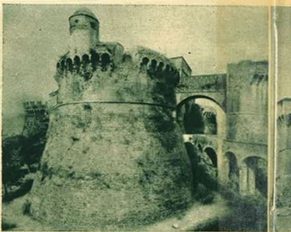
Sarzana (Liguria) - Castello di Castruccio, (XIV secolo) (Ed. Altinari).