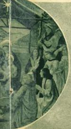
Allievo Pitti, Firenze (Fot. Anderson, Roma).