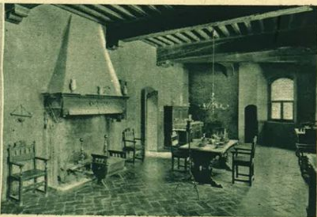
Cucina del Trecento. Palazzo Davanzati, Firenze.

Non venivano negate neanche ai prigionieri le soddisfazioni affettuose e soavi della festa natalizia.