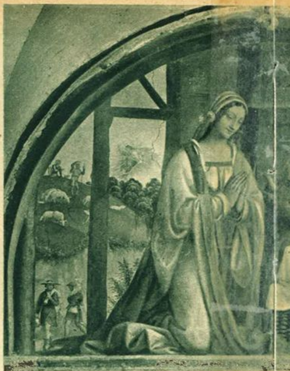
Saronno - Nascita di Gesù, affresco di Bernar...