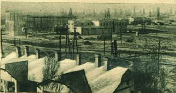
Baku - Pozzi petroliferi.

Nel suo complesso la nuova geografia politica della Transcaucasia non tiene conto rigorosamente dei limiti fisici della regione, per cui, come per il passato il termine Caucasia , e come per il presente Caucasia settentrionale e Transcaucasia , non