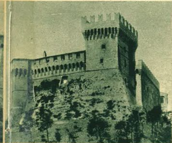
Gradara (Marche) - La Rocca (edificata dai Malatesta e riedificata da Giovanni Sforza).