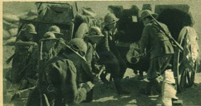
Sopra: durante un'azione d'artiglieria sul fronte della Marmarica. Sotto: carri armati nemici distrutti.