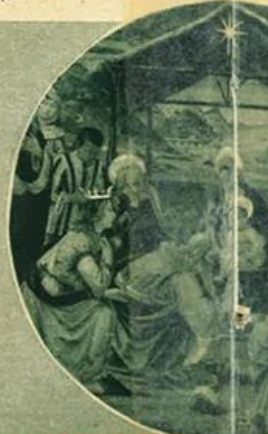
Ghirlandajo - L'Adorazione dei Magi - Galleria P...