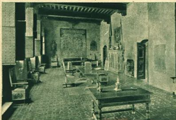
Sala del Trecento, Palazzo Davanzati, Firenze (Fot. Broggi, Firenze).