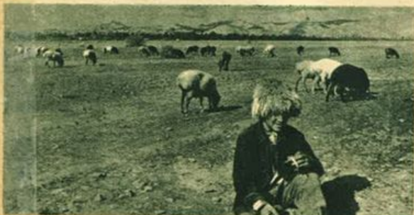
Caucaso - Allevamento di bestiame.

Tutta la regione russa che si stende, tra il Mar Caspio e le coste del Mar Nero e del Mar d'Azof, attraversata dalla Catena montuosa del