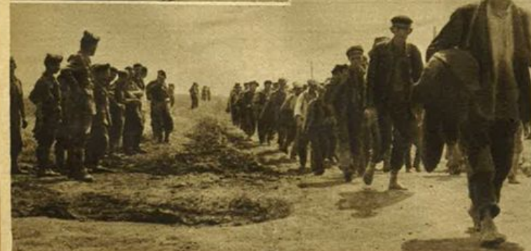
L'avanzata del Corpo di Spedizione italiano in Ucraina. - Le prime colonne di prigionieri sovietici affluiscono verso le retrovie.