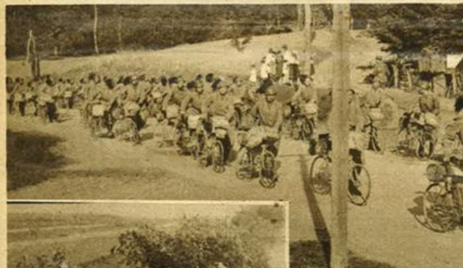
Sopra: Ucraina - Nostri reparti celeri in marcia di avvicinamento.