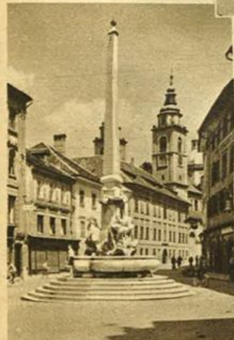
Fontana del Robba davanti al Municipio.