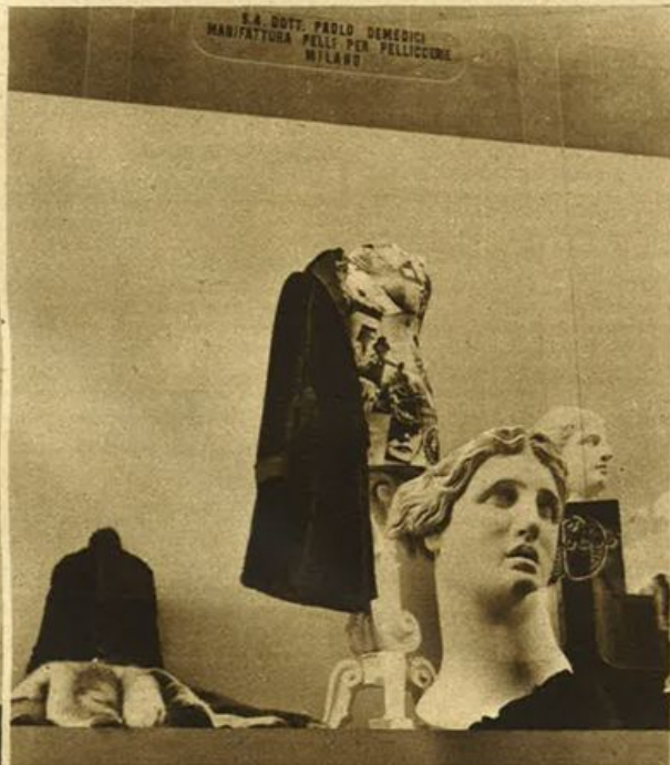
Pellicceria autarchica.