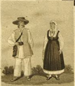
Forma antica del costume nazionale della quale dice lo storiografo Valvasor che si porta in tutta la Carniola inferiore, mentre oggi è indossata solamente dai tedeschi di Kocovje.

nifesta solamente nell'arte e nella cultura ma anche nel costume popolare. Infatti il costume nazionale sloveno risente moltissimo dell'influsso dei costumi popolari delle regioni finitime delle tre Venezia. Il ricamo veneziano arricchisce i ghirigori delicati della « pecca ». Gli ori e gli ornamenti sono più ricercati se di fattura italiana. Gli scialli ricamati con le lunghe frange sono di Venezia, gli orecchini di Fiume.