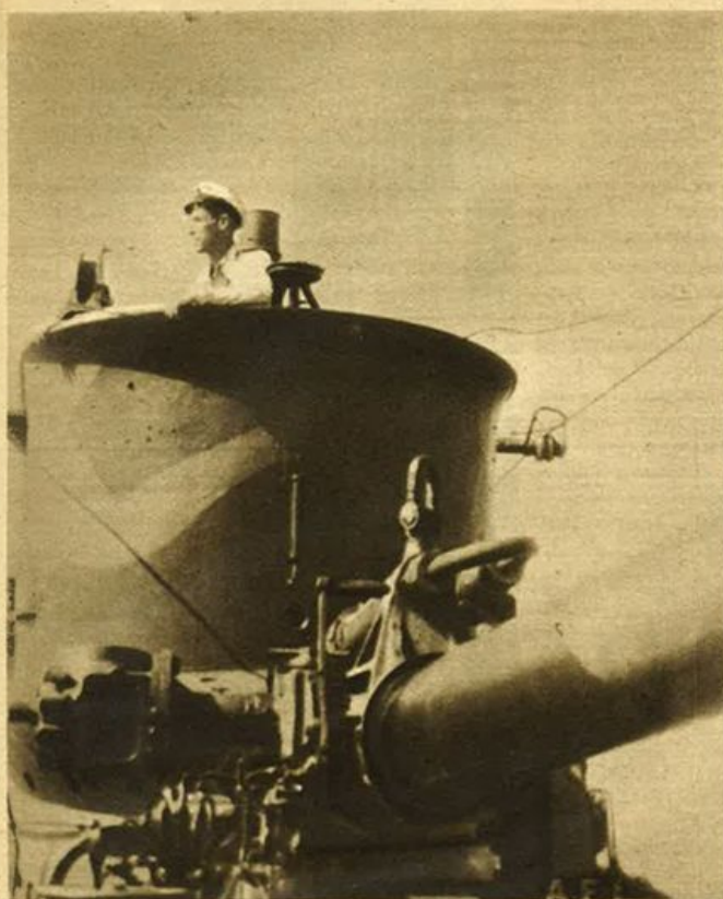
Da una nostra base navale... 25 Agosto 1941-XIX. - Il giorno x, alle ore x, un sommergibile parte, va lontano profondo, profondo nel mare. Quale sarà il suo destino? Il suo orizzonte è ignoto; ma mezz'ora prima di mollare gli ormeggi ecco gli straordinari tonitrali del suo equipaggio. Sereni, il cuore acceso da verdi speranze di vittoria. - Qui il comandante è sulla torretta per dirigere la navigazione.