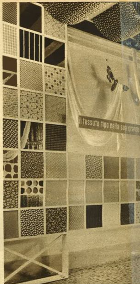
Mostra dell'Ente del T...

I « tessuti tipo » sono in buona parte di fibra artificiale: raion, fiocco, bemberg, acetil ecc., e in minor numero di fibra naturale quali la canapa, la seta, il gelsofil: tutti prodotti esclusivamente autarchici, che per la filatura e la tessitura danno lavoro