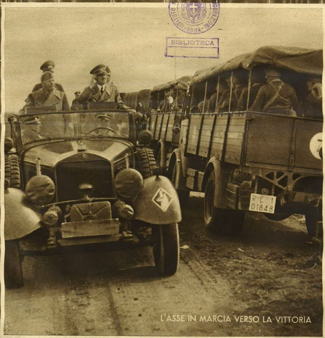
L'ASSE IN MARCIA VERSO LA VITTORIA