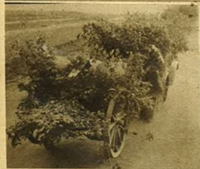
A sinistra: Nostre artiglierie, mascherate, trasportate verso le prime linee.