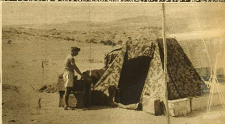
Fronte di Tobruck. - Una stazione radio da campo.