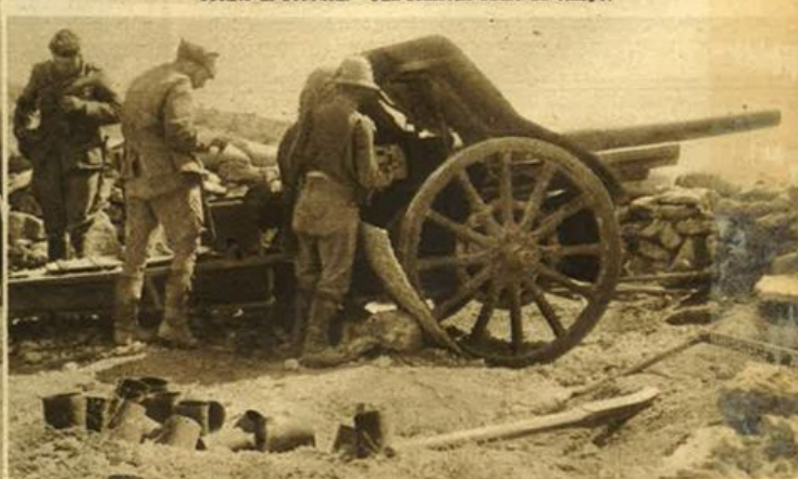
Nostre postazioni di artiglieria nel settore di Tobruck.