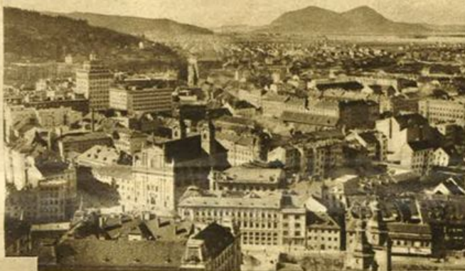
Lubiana vista dal castello.