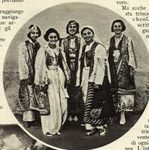
Nel tondo, Costumi albanesi. - A sinistra, scavi della Missione Archeologica Italiana in Albania: Butrinto: l'Acropoli.

Anche qui, una torre quadrata denota l'importanza che strategicamente romani e bizantini annettevano a questa località, dove sorgeva d'altronde un centro abitato, che, dalle vestigia che sono venute e che seguitano a venire in luce nel corso dei lavori di scavo, sembra essere stato più che notevole.