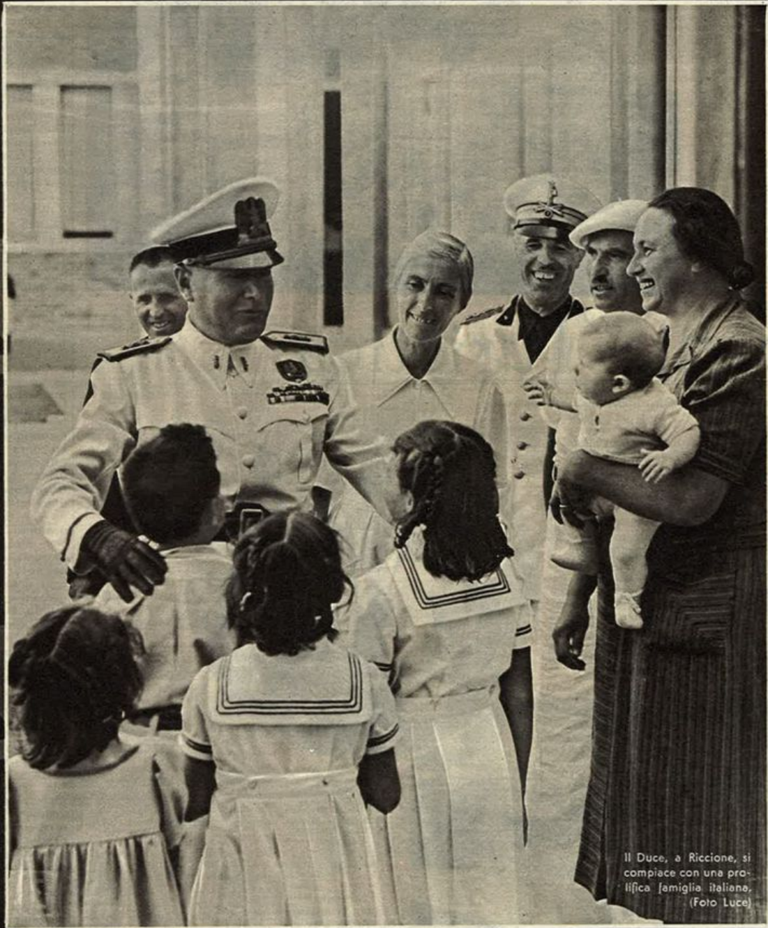
Il Duce, a Riccione, si compiace con una pro- lifica famiglia italiana.