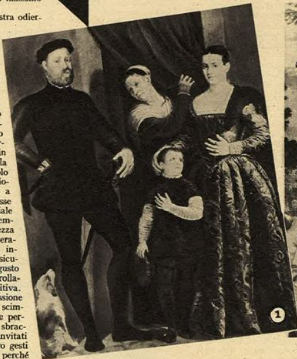
1. Ritratto di famiglia (S. Francisco, Museo della Legion d'onore). - 2. Veronese Paolo: Mosè salvato dalle acque (Madrid, Gall. del Prado).