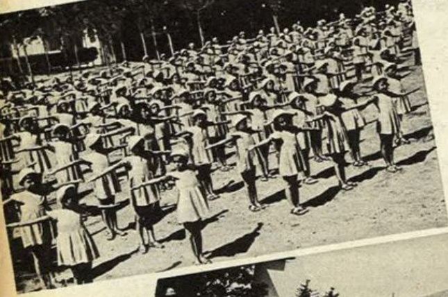
A destra: Fasci Italiani all'estero - Villaggio Alpino Balilla.