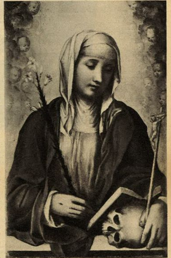
Sodoma: Santa Caterina (Siena, Accademia Belle Arti).