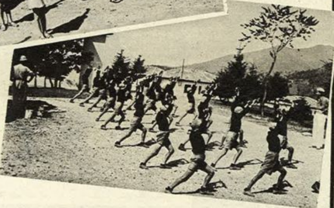
A sinistra: bimbi albanesi della Colonia Gonda di Riccione.

MAGNIFICHE VISIONI DI BIMBI DEL POPOLO CHE TEMPRANO IL CORPO E LO SPIRITO NELLE COLONIE DEL PARTITO