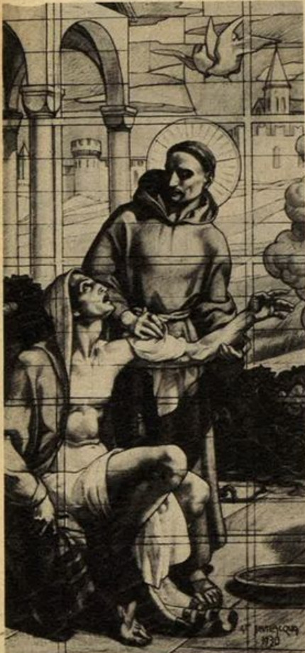
G. Bevilacqua: S. Francesco e il lebbroso (Chiesa degli Spedali Civili di Genova - particolare della vetrata).