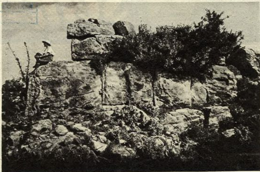
Scavi della Missione Archeologica Italiana in Albania: Butrinto: L'Acropoli.

Eppure, in altri tempi, il suolo, le acque di questo luogo dovevano certamente obbedire ad un altro regime tanto da indurre le genti a costruirvi città e templi, ville e fortificazioni ed a scegliere la località per stabilirvisi.