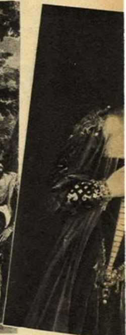
3. Ritratto di del Louvre - Firenze). - 4. L'Ado Chiesa dei Sa.

felicissima gioia, assoluta sicurezza di composizione fondi e scorci. Sin dalle prime opere, sin dalla sua giovanile decorazione di Masèr egli dimostra questa gioiosa fusione tra forma e pensiero, fantasia e realizzazione.