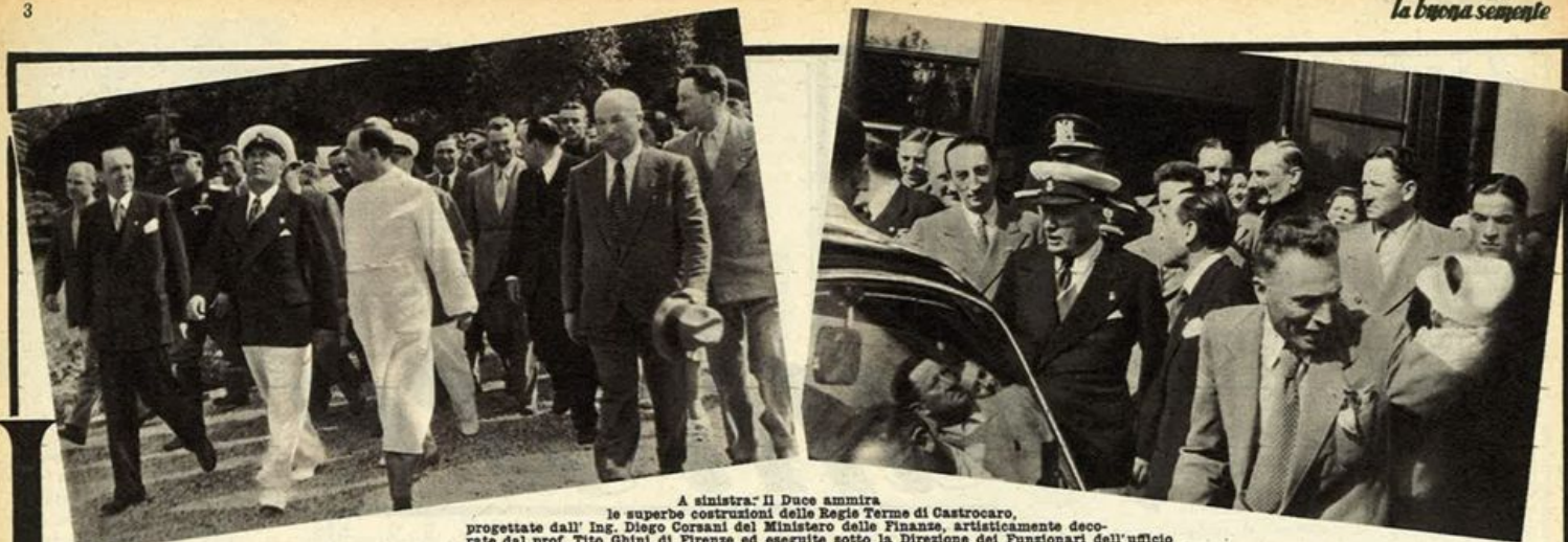
A sinistra: Il Duce ammira le superbe costruzioni delle Regie Terme di Castrocaro, progettate dall'ing. Diego Corsani del Ministero delle Finanze, artisticamente decorate dal prof. Tito Ghini di Firenze ed eseguite sotto la Direzione dei Funzionari dell'ufficio Tecnico di Forlì. - A destra: Il Duce nell'atto di congedarsi e congratularsi con i Dirigenti ed i sanitari delle Regie Terme di Castrocaro.