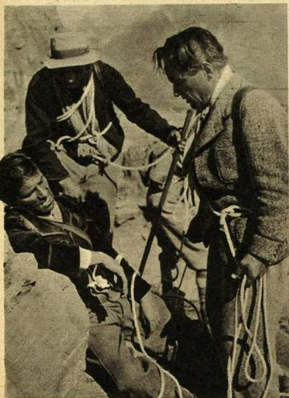
Una scena de "La grande conquista" - Escl. ENIC

Possiamo tener presente, tra la produzione apparsa sui nostri schermi in questi primi mesi del nuovo anno, tre lavori che, ispirandosi a tre diversi generi, dicono per ognuno una parola significativa se non definitiva.