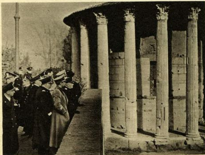
Il Duce visita i lavori sulla via del mare