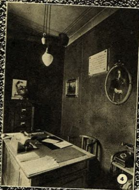
1. Benito Mussolini all'adunata di Napoli che ha immediatamente preceduto la Marcia su Roma. 2. I Quadrunviri. - 3. Il "Covo" (Via Paolo da Cannobbio). - 4. Lo studio del Duce nel "Covo".