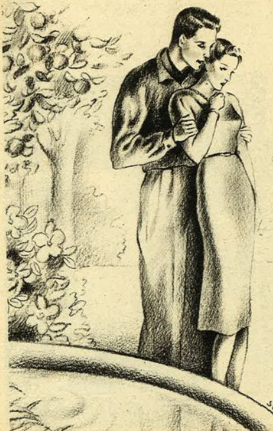
...aveva trovato il modo di sussurrarle il gran bene che le voleva.