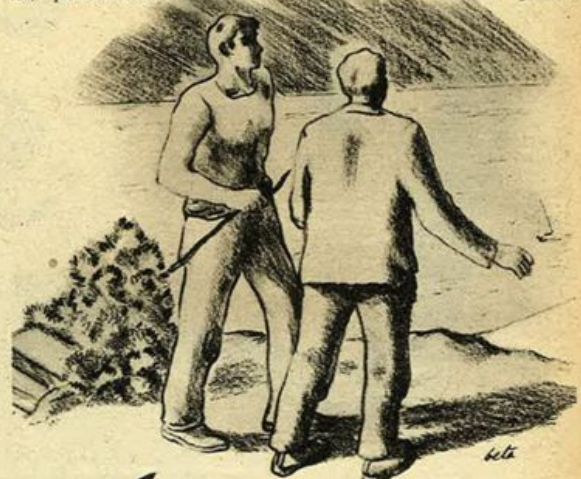
«...di là non c'era che azzurro, come una gran luce infinita: il mare.»

Benvenuto s'imbrancava coi giovanotti e qualche ragazza; e, a volte, tenendosi in fila con le mani sulle spalle o sottobraccio, prendevano