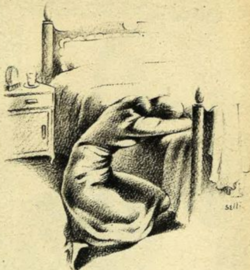
...ingnocchiata ai piedi del letto, stette a lungo...

La vecchia casa s'era ravviata e il parco, dietro il giardinetto, ravvivato. Un largo spiazzo, al fianco della vasca coi pesci vecchissimi, gli compagni della bimba di un tempo, ospitava ora le gioconde brigate che cercavano come loro reginetta la Licia. Un piccolo stuolo di ragazze vaporose, nelle vesti a sbuffi, d'una gaiezza innocente, e giovinotti scamiati nella furia del gioco del tennis o del calcio, venivano nella buona