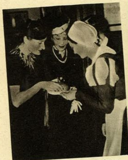
La Contessa Ciano-Mussolini riceve l'offerta del pane e del sale