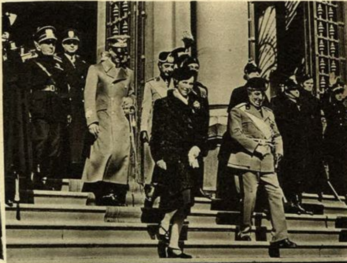
I Principi di Piemonte alla celebrazione leopardiana.