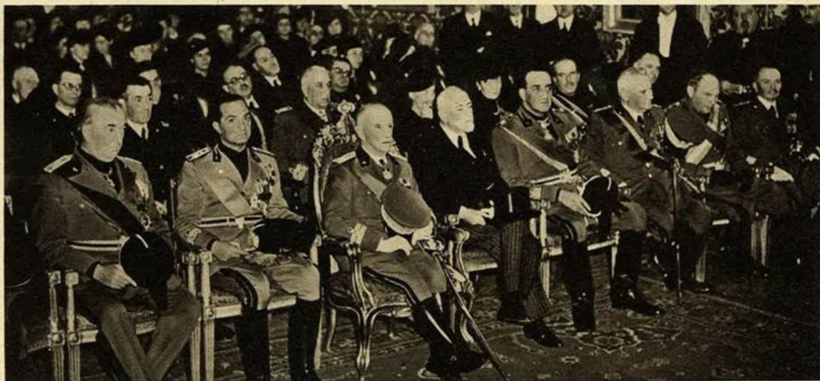
Il Re Imperatore alla R. Accademia di S. Luca

Memento - Chi vive del proprio lavoro, deve assicurarsi la vita per poter comodamente sopperire ai bisogni della sua vecchiaia.