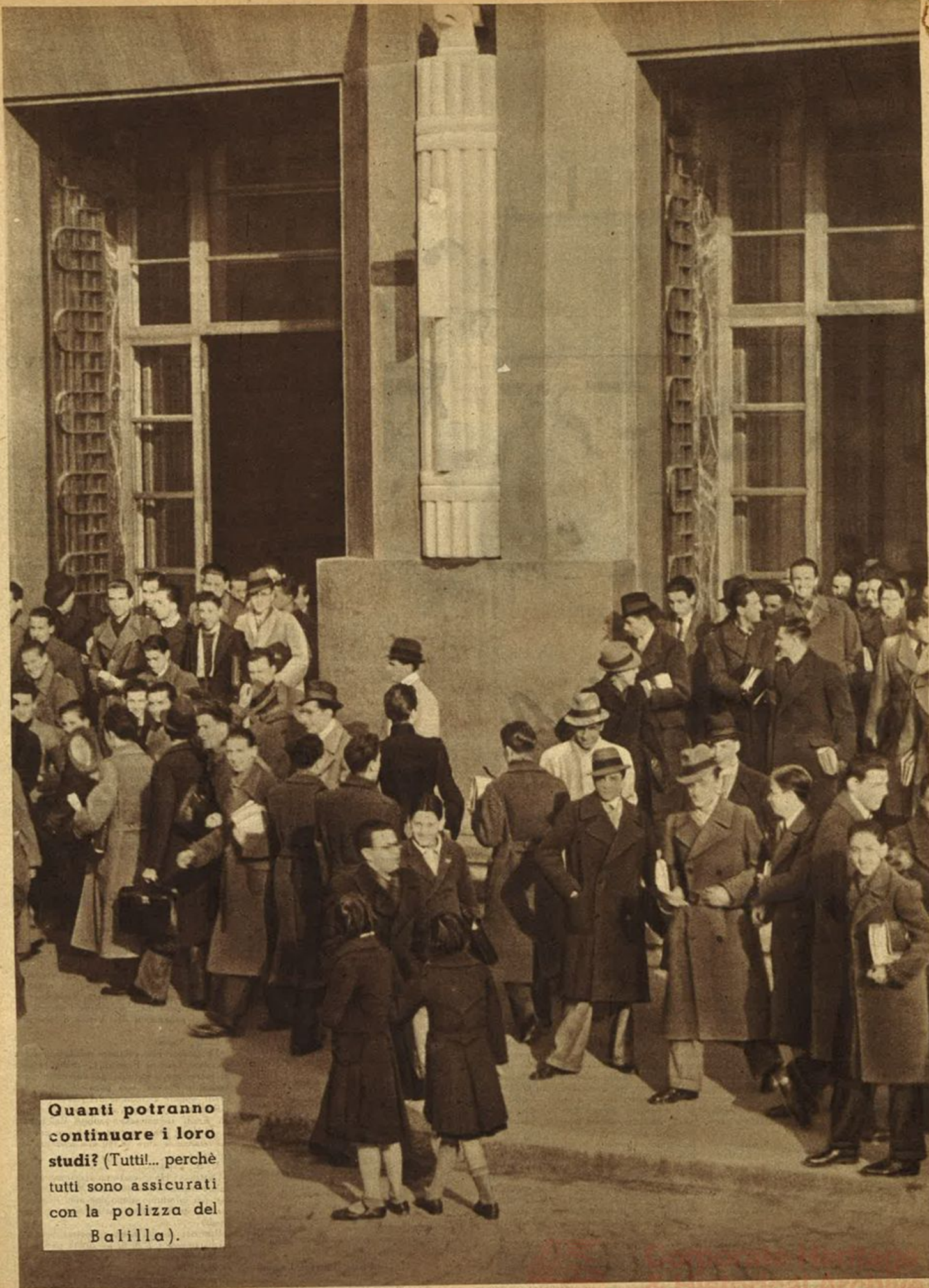
Quanti potranno continuare i loro studi? (Tutti!... perchè tutti sono assicurati con la polizza del Balilla).