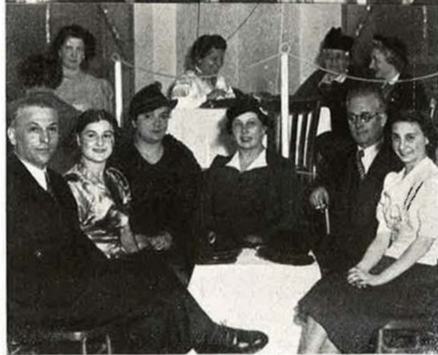
Il buon umore dei nostri pomeriggi danzanti... eternato dall'obbiettivo