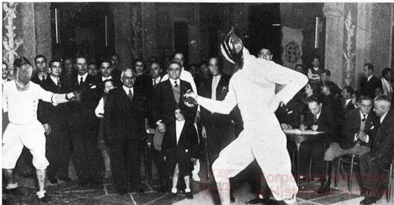
UN INCONTRO DI SCIABOLA