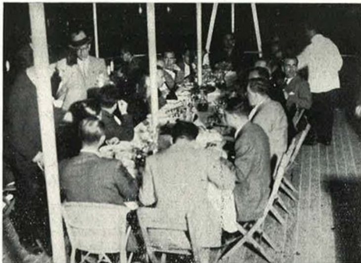
Al nostro galleggiante. Una volta si gridava: « mollate! »; ora anche si ripete: « mollate »; ma per intendere gli spaghetti nell'acqua.

Stabilimento Tipografico "EUROPA", Roma - Via dell' Anima, 46 - Telef. 561-480