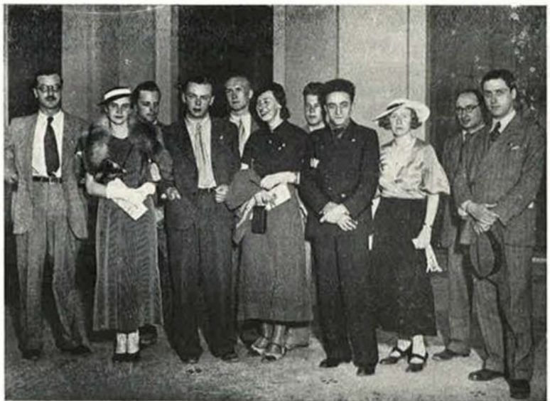
Anche un gruppo di universitari finlandesi è venuto a visitare il nostro Dopolavoro manifestando la più viva simpatia per le nostre attività.