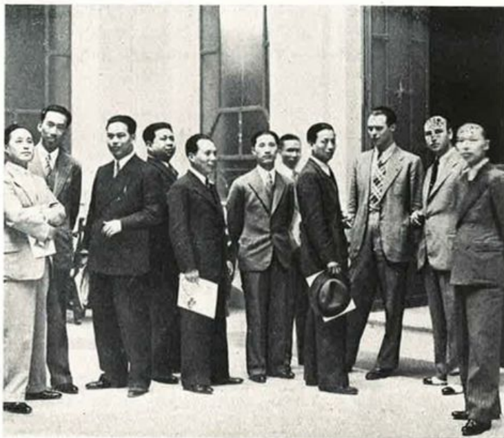
Un gruppo di studenti cinesi ha visitato la nostra sede ammirando la nostra organizzazione.

le Assicurazioni è stato vinto dalla nostra squadra che si è aggiudicata per l'anno XIII la Coppa.